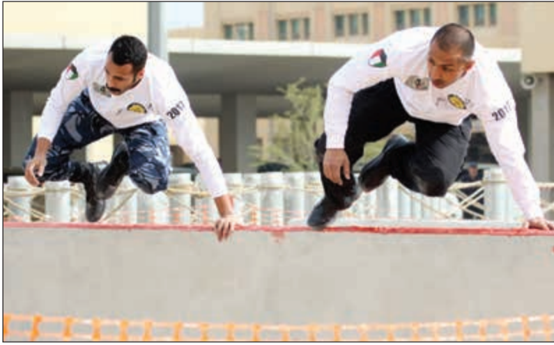
تخطي الحاجز والحصون بسرعة ومهارة