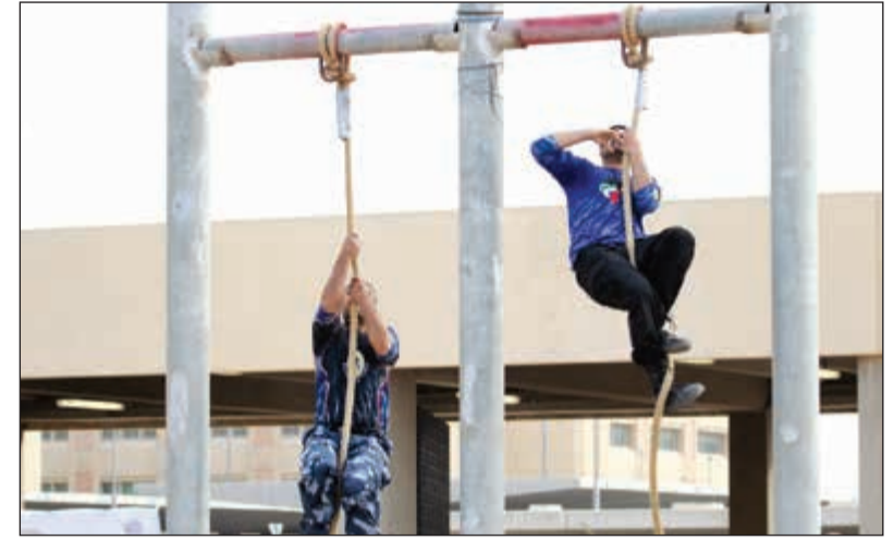
تنفيذ مهارات الاقتحام بحرفية خلال المسابقة