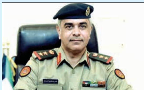
المحقق العسكري في قطر العقيد الركن ناصر السمحان

يأتي وفقاً لتوجيهات نائب رئيس مجلس الوزراء وزير الدفاع الشيخ محمد خالد ورئيس هيئة الأركان العامة للجيش الفريق الركن محمد الخضسر وتوجيهات وزير الدولة لشؤون الدفاع القطري د.خالد بن محمد العطية ورئيس أركان القوات المسلحة القطرية الفريق الركن غانم الغانم. الفنية للأفراد المشاركين فيه إضافة إلى تعزيز المهارات الفردية والجماعية وفقاً للمستجدات الحديثة في التدريب العسكري. وأوضح أن التمرين يهدف إلى الاستفادة من خبرات الجانبين في مجال النظريات والتكتيكات العسكرية الحديثة وتبادل الخبرات المكتسبة من خلال التمارين والتدريبات التي أجراها كل جانب خلال السنوات الماضية. وأفاد بأن التمرين المشترك