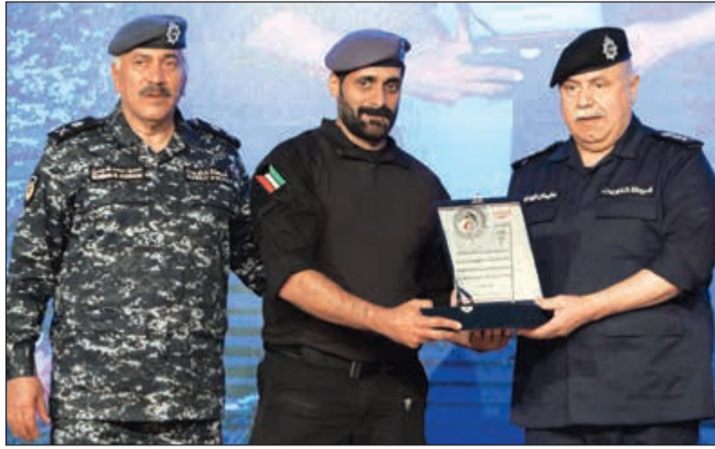
الفريق سليمان الفهد واللواء محمود الدوسري يكرم أحد الفائزين