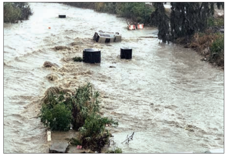
امطار هائلة اغرقت منطقة عسير بالمملكة العربية السعودية