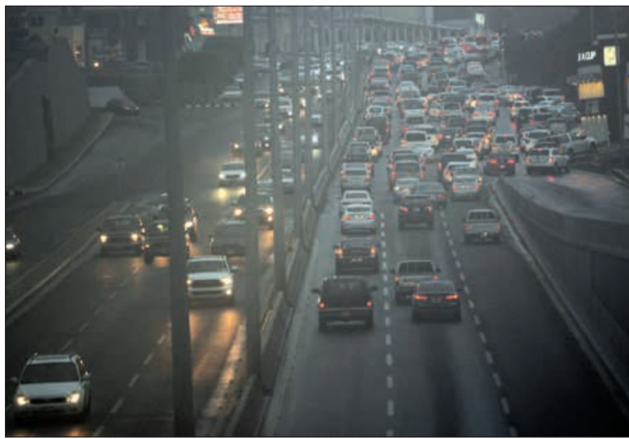
ازدحام مروري شديد في عسير بسبب الامطار

جاسم التنيب أوضح مراقب التنبؤات الجوية بإدارة الأرصاد الجوية عبدالعزيز القراوي ان البلاد تأثرت أمس بامتداد منخفض السودان الموسمي مصحوبا مع كتلة هوائية رطبة ورياح جنوبية شرقية ادت الى تكون