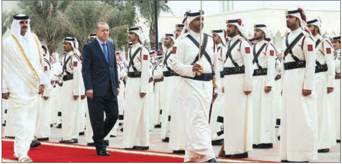
أمير قطر والرئيس التركي يستعرضان حرس الشرف قبيل مباحثاتهما في الدوحة أمس

السنة سيصيب في مصلحة كلا البلدين، فكل لقاء جمعنا يعزز الروابط الفكرية والعاطفية بيننا». وشدد أردوغان على أن قطر وتركيا تدعمان السلام الإقليمي، بالإضافة إلى وضع حد للإرهاب وجميع أنواع التهديدات والمخاطر الأمنية، وكلا البلدين يقوم بواجبه في هذا الصدد، مناشدا جميع البلدان الأخرى في المنطقة لتوسيع التعاون كدول شقيقة وتتصدى معا للإرهاب والتهديدات الأمنية.