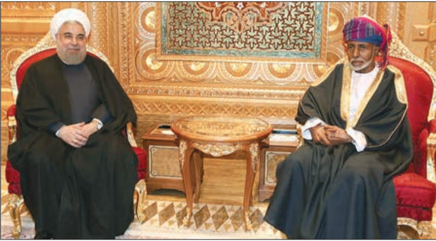
السلطان قابوس بن سعيد والرئيس الإيراني حسن روحاني خلال مباحثاتهما في مسقط أمس

عواصم - وكالات: بحث السلطان قابوس بن سعيد سلطان عمان مع الرئيس الإيراني حسن روحاني، في مسقط أمس، التطورات على الساحتين الإقليمية والدولية. وذكرت وكالة الأنباء عمان الرسمية «أونا» أن الجانبين بحثا أيضا العلاقات الثنائية بين البلدين في المجالات السياسية والاقتصادية والتجارية والسياحية. ورحب روحاني في تصريح صحافي قبيل توجهه الى سلطنة عمان بالرسالة التي تلقاها بلاده مؤخرا من دول مجلس التعاون لدول الخليج العربية عبر الكويت بشأن العلاقات