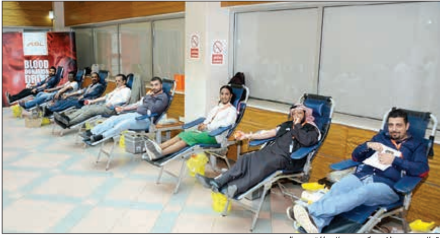
إقبال من موظفي «كي جي ال» للتبرع بالدم