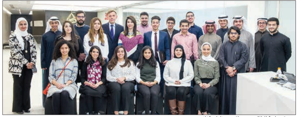
صورة جماعية للطلاب مع موظفي «صناعات الغانم»