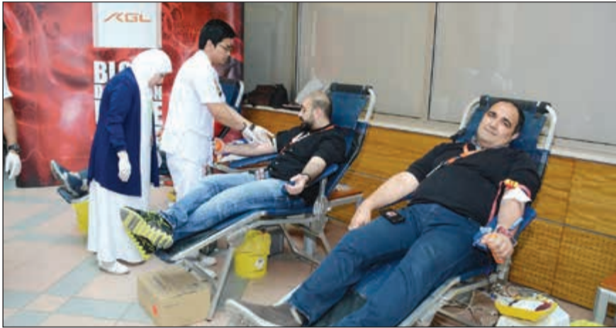
جانب من عملية التبرع

لخدمة المجتمع الكويتي في جميع المجالات سواء فيما يتعلق بالمسؤولية الاجتماعية أو التنمية الاقتصادية، داعياً الجهات الحكومية لحل المشاكل التي تواجه القطاع الخاص.