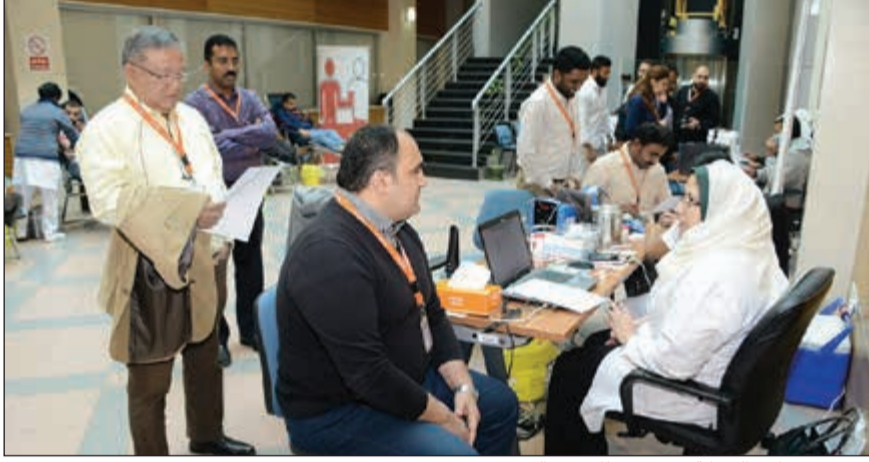
عدد من موظفي الشركة يستعدون للتبرع بالدم