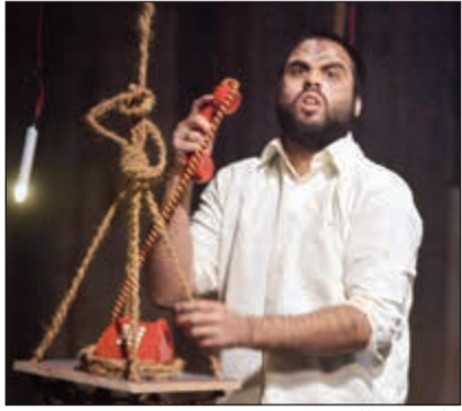
أداء متميز للدرزي