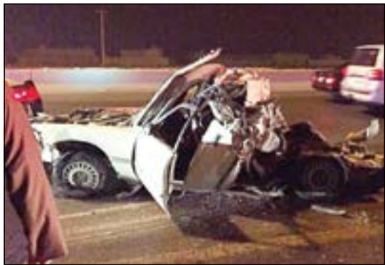
حادث مروري من بين الحوادث التي شهدتها البلاد