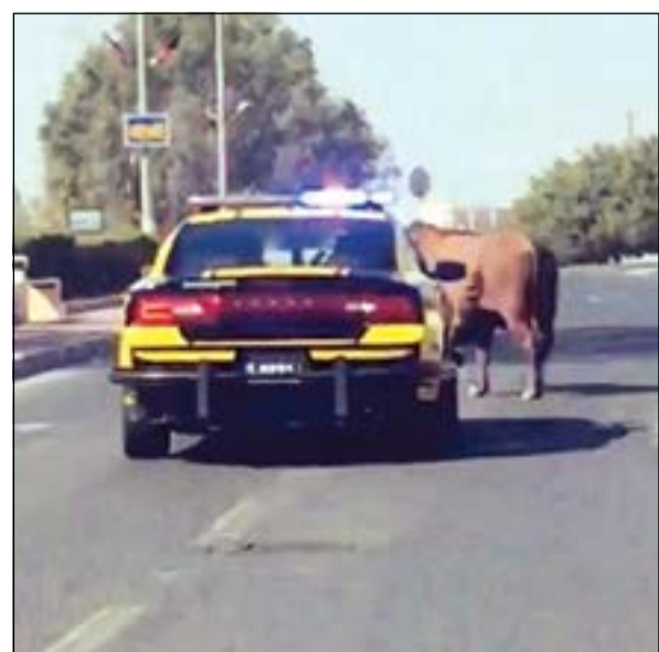
دوريات النجدة حاولت السيطرة على الثور وعندما فقدت السيطرة عليه رمته بالرصاص

سيطرت دوريات النجدة على ثور هائج بإطلاق النار عليه وقتله وذلك بعد وصوله إلى منطقة الرميثية. وزارة الداخلية يفيد بهروب ثور هائج من مسلخ السالمية متجهاً إلى الدائري الخامس، وهرعت على الفور دوريات النجدة إلى موقع البلاغ وعند وصولهم حاولوا توقيفه إلا أن محاولتهم باءت بالفشل إلى أن دخل منطقة الرميثية، الأمر الذي دفع رجال الأمن إلى إطلاق النار وقتله للحفاظ على سلامة مرطادي الطريق.