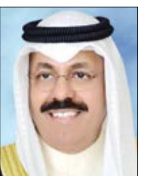
الفريق أول م. الشيخ أحمد النواف

تحت رعاية وحضور محافظ حولي الفريق أول م. الشيخ أحمد النواف تقيم المحافظة احتفالها الرسمي بالأعياد الوطنية 2017، والمتمثل في «جائزة محافظة حولي للتميز 2017» للعام الثامن على التوالي، وذلك اليوم الأربعاء بفندق الجميرا قاعة بدرية. وبهذه المناسبة، أكد محافظ حولي الفريق أول م. الشيخ أحمد النواف أن «جائزة محافظة حولي للتميز»