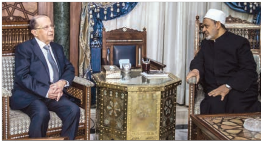
الامام الاكبر احمد الطيب مستقبلا عون في مشيخة الأزهر الشريف