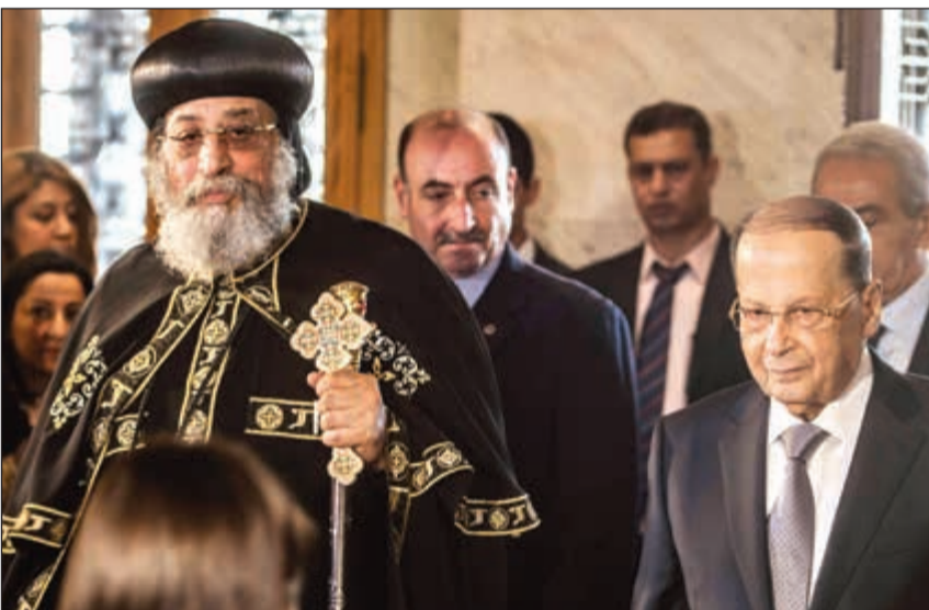
بابا الاقباط الارثوذكس تواضروس الثاني مستقبلا الرئيس ميشال عون في مقر الكاتدرائية المرقسية بالعباسية

مصر ستواصل دعمها للبنان الشقيق على جميع الأصعدة. وأضاف: «لقد سعت مصر دوما للحفاظ على كيان واستقرار الدولة اللبنانية ومؤسساتها، حيث تواصلت على مدار الفترة الماضية مع مختلف القوى السياسية اللبنانية لتأكيد ضرورة اعتماد الحوار أساسا لحل الخلافات، كما كانت مصر من أولى الدول التي رحبت بقدرة اللبنانيين على التوصل إلى تسوية سياسية، صنعت في لبنان بعيدا عن تدخل القوى الخارجية، وحافظت على النموذج اللبناني الفريد»، في التعاليم بين كامل طوائف ما يجعل لبنان نموذجا رائدا في المنطقة لتسوية الأزمات سياسيا». السيد، التقى عون امس بابا الاقباط الارثوذكس تواضروس الثاني في مقر الكاتدرائية المرقسية بالعباسية بالعباسية، وحافظت على «النموذج اللبناني الفريد»، في التعاليم بين كامل طوائف ما يجعل لبنان نموذجا رائدا في المنطقة لتسوية الأزمات سياسيا». السيد، التقى عون امس بابا الاقباط الارثوذكس تواضروس الثاني في مقر الكاتدرائية المرقسية بالعباسية بالعباسية، وحافظت على «النموذج اللبناني الفريد»، في التعاليم بين كامل طوائف ما يجعل لبنان نموذجا رائدا في المنطقة لتسوية الأزمات سياسيا».