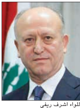
اللواء اشرف ريفي

يلتقي اللواء اشرف ريفي بوثرة مكتفة وفودا وشخصيات سنية تأتي من بيروت والبقاعين الغربي والشمالى وأقليم الخروب، في إطار تعبئة الصفوف وتحضير الأرضية للانتخابات النيابية، وسيحاول من خلال معركته المقبلة انتزاع «بطاقة انتساب» الى نادي الاقطاب او الزعماء السنة، وبالتالي اثبات ان فوزه في الانتخابات البلدية لم يكن ضربة حظ، كما يعتقد بعض خصومه. ويوحي ريفي ان لديه كل الثقة في قدرته على خوض انتخابات ندية في مواجهة تيار المستقبل، ضمن الدوائر التي تضم غالبية سنية من