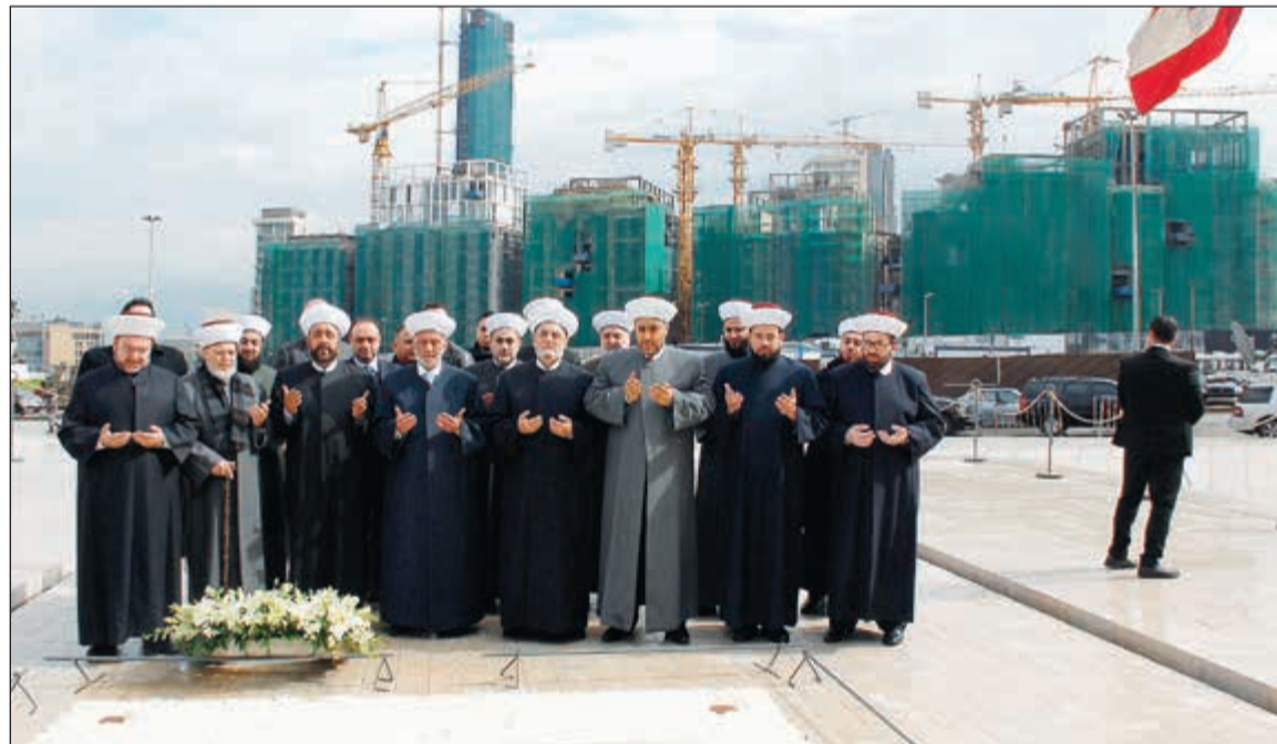
مفتي لبنان الشيخ عبد اللطيف دريان ووفد من رجال الدين يزورون ضريح الرئيس الشهيد رفيق الحريري في الذكرى الـ 12 لاستشهاده

كبرى من السلطات السياسية والروحية أيضاً. وأشار باسيل الى مطلب انشاء مجلس الشيوخ المصنوع بوثيقة الطائف، للمحافظة على المكونات الكابينة للمبلد، بحيث يكون هناك مجلس شيوخ ومجلس نواب، أحدهما رئيسه مسيحي والآخر رئيسه مسلم، ما يعني ان رئاسة مجلس الشيوخ التي يراهن عليها وليد جنبلاط للدروز، يريد بها باسيل لشخصية مسيحية. بدوره، تيار المستقبل، وفي رد ضمنى على الرئيس عون، قال عبر قناة المستقبل: وحده الجيش اللبناني يحمي لبنان .. وحدهم جنود الجيش هم الشجعان على الحدود وفي الداخل، يحمون اللبنانيين. وفي رد على الرد، سالت قناة أوت.تي.في: هل كان هناك من يتوقع في مكان ما، ان ينقلب ميشال عون على ذاته ويعلم ان حزب الله منظمة اراهابية ينبغي استئصالها من لبنان؟