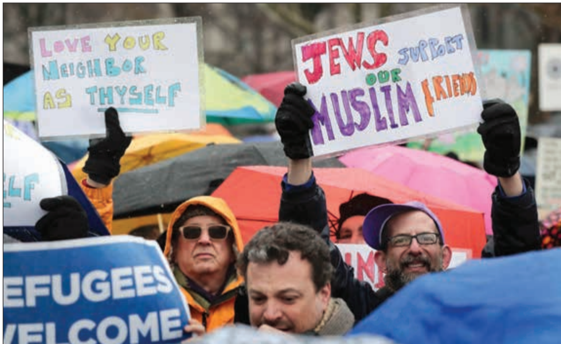
متظاهرون يهود يرفعون لافتات مناهضة لسياسات ترامب تجاه المهاجرين خلال تظاهرة في نيويورك أمس الأول

عواصم - وكالات: حذرت وزارة الخارجية الألمانية حكومات الدول الأعضاء في الاتحاد الأوروبي من إبرام اتفاقيات ثنائية، خاصة مع إدارة الرئيس الأمريكي دونالد ترامب، وقال وزير الدولة الألماني للشؤون الخارجية ميشائيل روت - «قلت»، الألمانية الصادرة امس: «لن يفيد أحد في أوروبا، إبرام بعض الدول لصفقات خاصة مع الولايات المتحدة»، وذكر روت أن النفوذ ليس ما تستند إليه العلاقات عبر الأطلسي، بل «القيم التي نتقاسمها على صفتي الأطلسي». نقول ذلك للأميركان بكل ثقة في النفس»، ودعا روت الإدارة الأميركية الجديدة إلى الوفاء بالتزاماتها داخل حلف شمال الأطلسي (الناتو)، وقال: «نراهن أيضاً على استمرار الإدارة الأميركية في ضمان القيم المشتركة للناتو، كتحالف أمني متضامن»، من جهتها، عبرت وزارة الخارجية الصينية امس