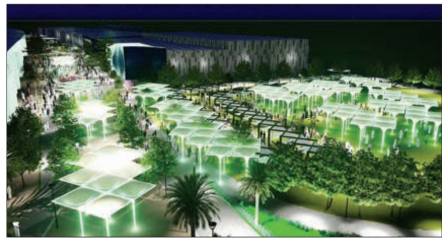
أحد جوانب مشروع تحويل شارع سالم المبارك إلى متنفس سياحي

منها بشكل محكم، مؤكداً أن الجهاز التنفيذي أمامه فرصة ذهبية لإجراء التعديل اللازم ومعالجة الكثير من السلبيات سواء ما يتعلق بلائحة البناء ومواقف السيارات الذكية وبقية اللوائح لدعم قانون البلدية. وحث رؤساء قطاعات شؤون المحافظات بالعمل على اتخاذ إجراءات فاعلة اتجاه مخالفات البناء في السكن الخاص، مشدداً على أن مسؤوليتكم تفعيل الجانب الرقابي والعمل على سرعة إزالة تلك المخالفات التي صدرت بها أحكام قضائية نهائية، مطالبا بسرعة الرد على أسئلة واقتراحات أعضاء مجلسي