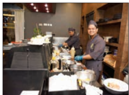
أعلى معايير الجودة