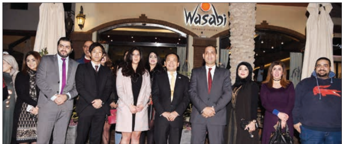
فريق العمل أمام مبنى المطعم عقب الافتتاح (ريليش كومار)