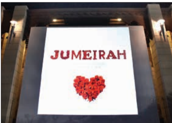
أوقات لا تنسى في «جميرا»

التي تتميز بموقعها وإطلالتها المثالية، فيما تقدم الحديقة السرية ملاذا خاصا يتسنى فيه للأزواج قضاء أجمل الأوقات، حيث يوفر الموقع الخارجي المناسب وسط المساحات الخضراء الخلابة وأنغام العزف الحي على الكمان مع تذوق أطباق قائمة الطعام الرائعة المكونة من خمسة أطباق أو أطباق الشواء المحضرة خصيصا لهذه الليلة. المناسبة بأسلوب خاص، حيث أدخل المنتج مؤخرا مجموعة جديدة من العلاجات العضوية تتضمن «نيوم» من لندن والتي تضمن للأزواج الاستمتاع بتجربة مليئة بالدلال وتجربة راقية مع مجموعة متنوعة من الزيوت العطرية الفريدة، كما يوفر المنتج العديد من تجارب الاسترخاء الفريدة مع قائمة خدمات السبا في الأجنحة الخاصة مثل جناح الهيمالايا والأجنحة المستوحاة من سحر الشرق.