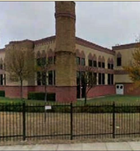
المركز الإسلامي في فورت وورث

مدينة فورت وورث تعبر بحق عن التعايش والتلاقي مع الآخر، تأسيساً على المبادئ الأميركية التي استوعبت المهاجرين من الدول المجاورة والدول الأخرى، فطبقاً للإحصاءات شبه الرسمية يشكل المكسيكيون نحو 30٪ من سكان المدينة، كما أن هناك جالية عربية ومسلمة كبيرة جداً تتمتع بكامل حقوقها في ممارسة الشعائر الدينية وتتعدد المساجد في المدينة، فضلاً عن المركز الإسلامي الكبير.