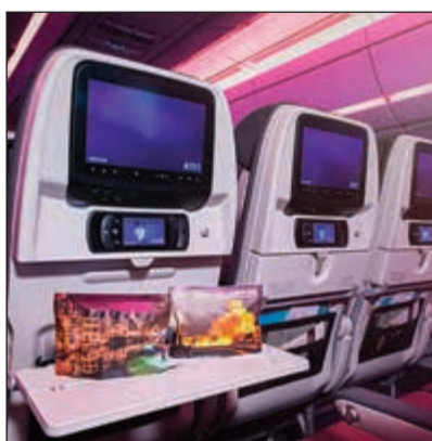
وسائل الترفيه متوفرة على متن الطائرة