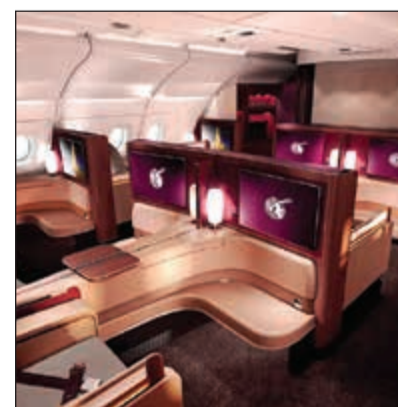
راحة وفخامة في «القطرية»

الخطوط الجوية القطرية تعد بالفعل معجزة حقيقية في عالم الطيران، حيث حققت قفزة ونموها هائلاً غير مسبوق، فالشركة التي أنشئت في العام 1994، أصبحت الآن أفضل شركة طيران بالعالم وحازت جائزتها أعوام 2011 و2012 و2015، كما أنها أفضل درجة لرجال الأعمال في العالم أعوام 2012 و2014 و2016. وتستطيع أن تلمس ذلك بنفسك إذا كنت من المسافرين على درجة رجال الأعمال في رحلة طويلة من الدوحة إلى الدالاس (مثلاً)، وهي رحلة تستغرق 14 ساعة طيران متواصلة، لكن أجواء الراحة والفخامة في «القطرية» وطاقم الخدمة المميز يحول رحلتك إلى عالم من الاستمتاع والاسترخاء، حيث يتسابق الجميع في تقديم أفضل الخدمات، ويمكن من خلال المقاعد الوعرة، التي تتحول إلى سرير مريح، الخلود إلى النوم والراحة خلال ساعات الرحلة ناهيك عن الوجبات