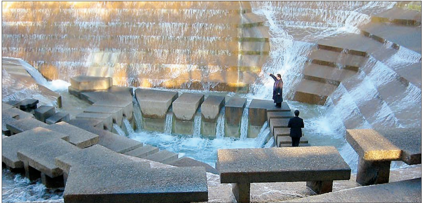
الحدائق المائية أهم ما يميز «فورت وورث»

لأن المنطقة تجسد التاريخ الأميركي، فإنها حافلة بعدد من المتاحف والمباني التاريخية التي يمكن للزائر من خلالها التعرف على كل تاريخ تكساس وأميركا عموماً.