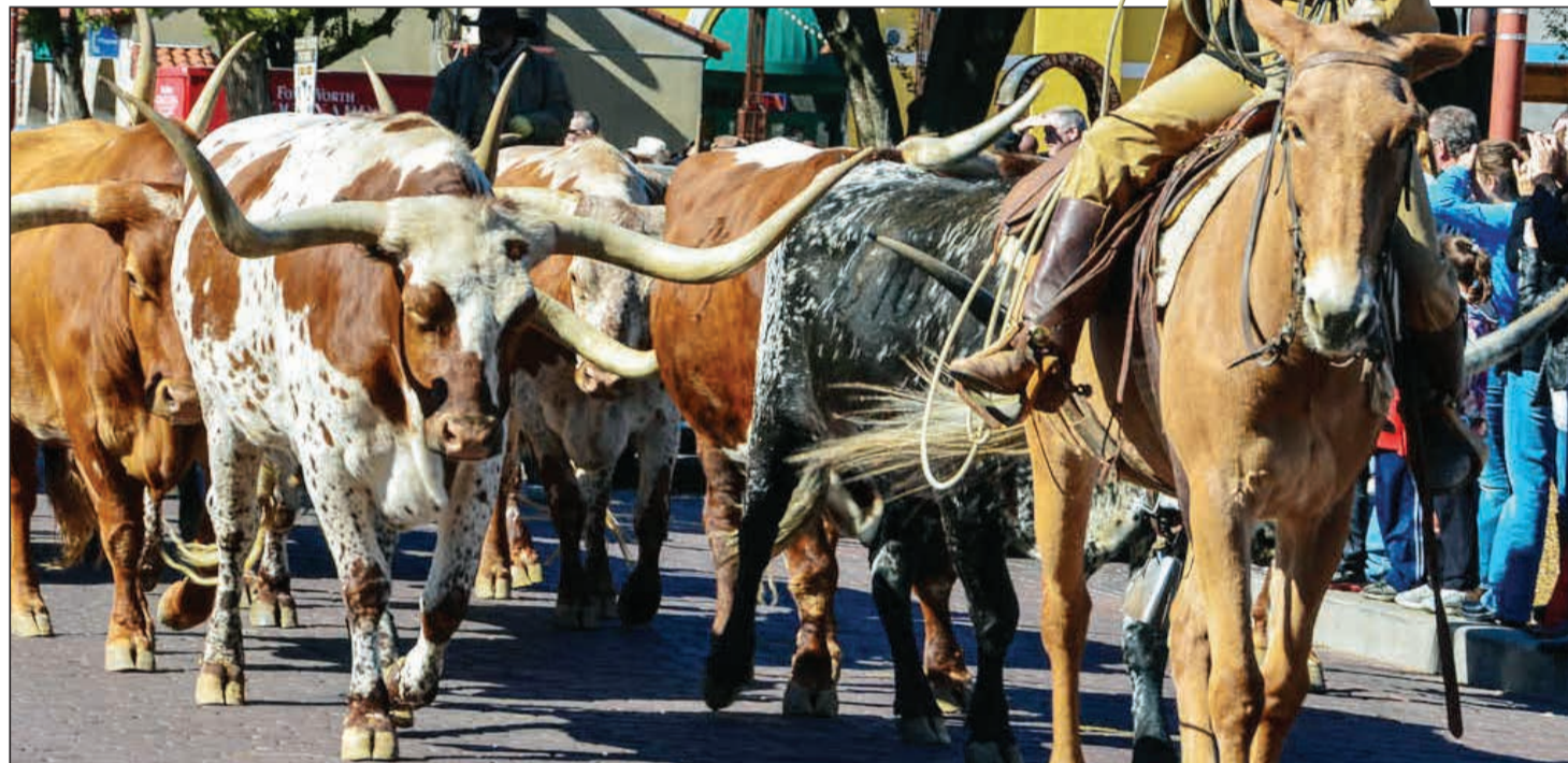
مسيرة رعاة البقر في «ستوك ياردز»

فعلى متن الخطوط الجوية القطرية كانت الانطلاقة، ومن مطار حمد الدولي في الدوحة كانت البداية، من مطار يجسد أعلى معايير الضيافة تشعر المسافر بالفخامة والرفيعة، فإلى جانب معماريته البديعة، ولمسات المصممين الرائعة، يوفر هذا المرفق الضخم فرصة للراحة والاسترخاء واستعادة الطاقة قبيل الرحلة (وتلك حكاية أخرى).