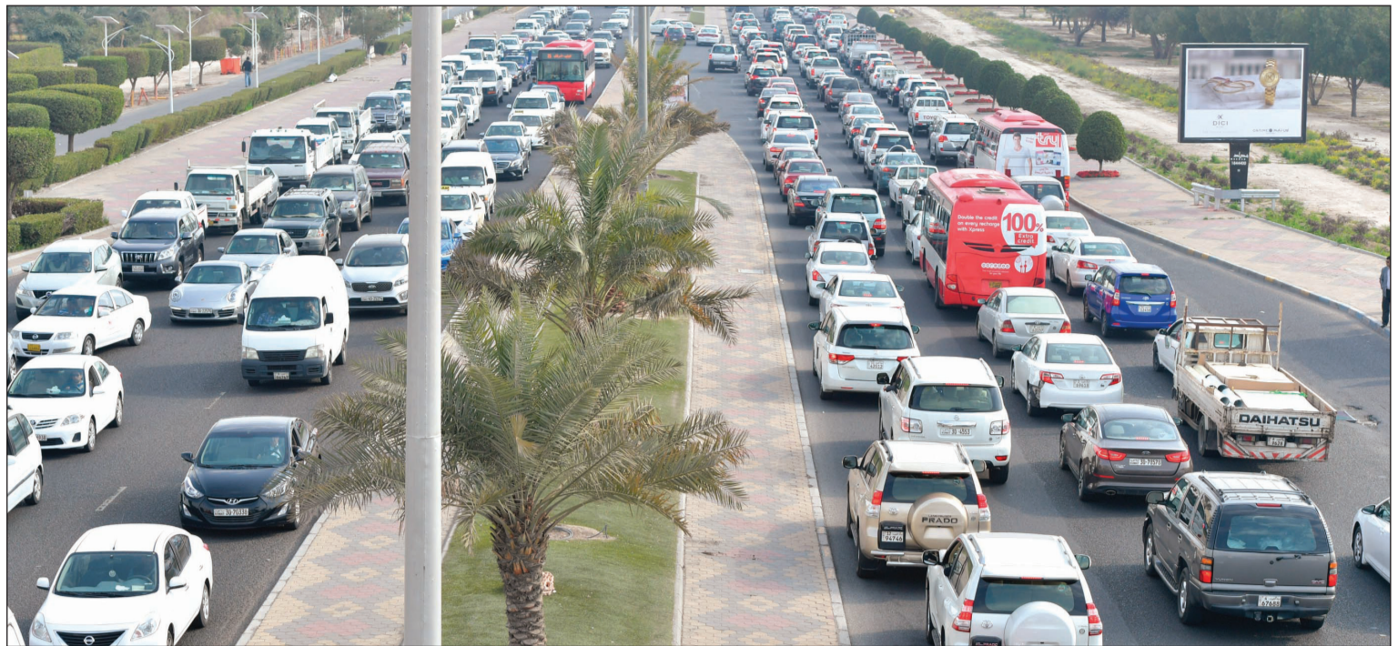
ازدحام شديد في طريق المطار ظهر أمس (قاسم باشا)

منطقة الشويخ كانت الأكثر ازدحاماً نظراً لإغلاق جسر الغزالي عند تقاطعه مع شارع جمال عبدالناصر تمهيداً لبناء جسر جديد.. تزامناً مع بداية الفصل الدراسي الثاني لطلبة الجامعة