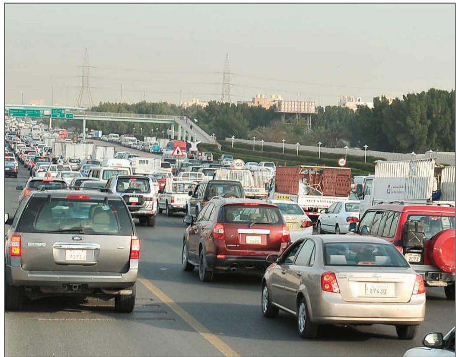
الازدحام طال الطرق الرئيسية المؤدية إلى منطقة الشويخ (زين علام)