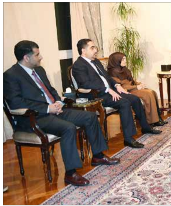
جانب من المباحثات بين الجانبين الكويتي والعراقي