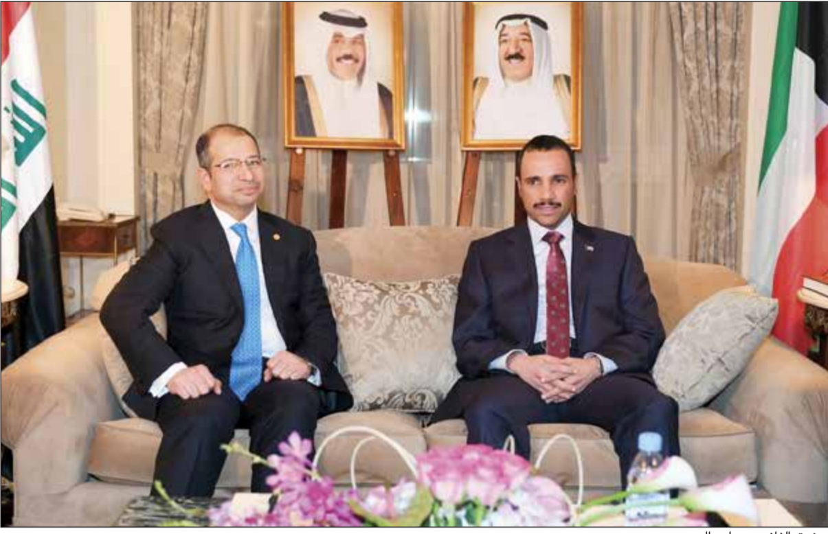
مرزوق الغانم ود.سليم الجبوري