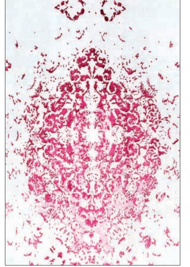
سجادة أصفهانية - رزفاني صوف وحريز 3 X 2