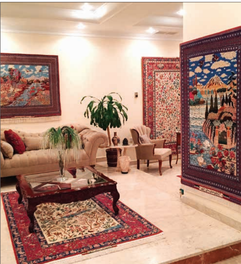
قطع صيرفيان الثمينة تزين منزل ميرزا