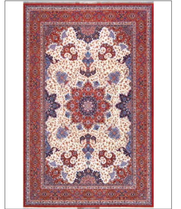
باقر صيرفيان صوف وحريز قياس 320 X 230