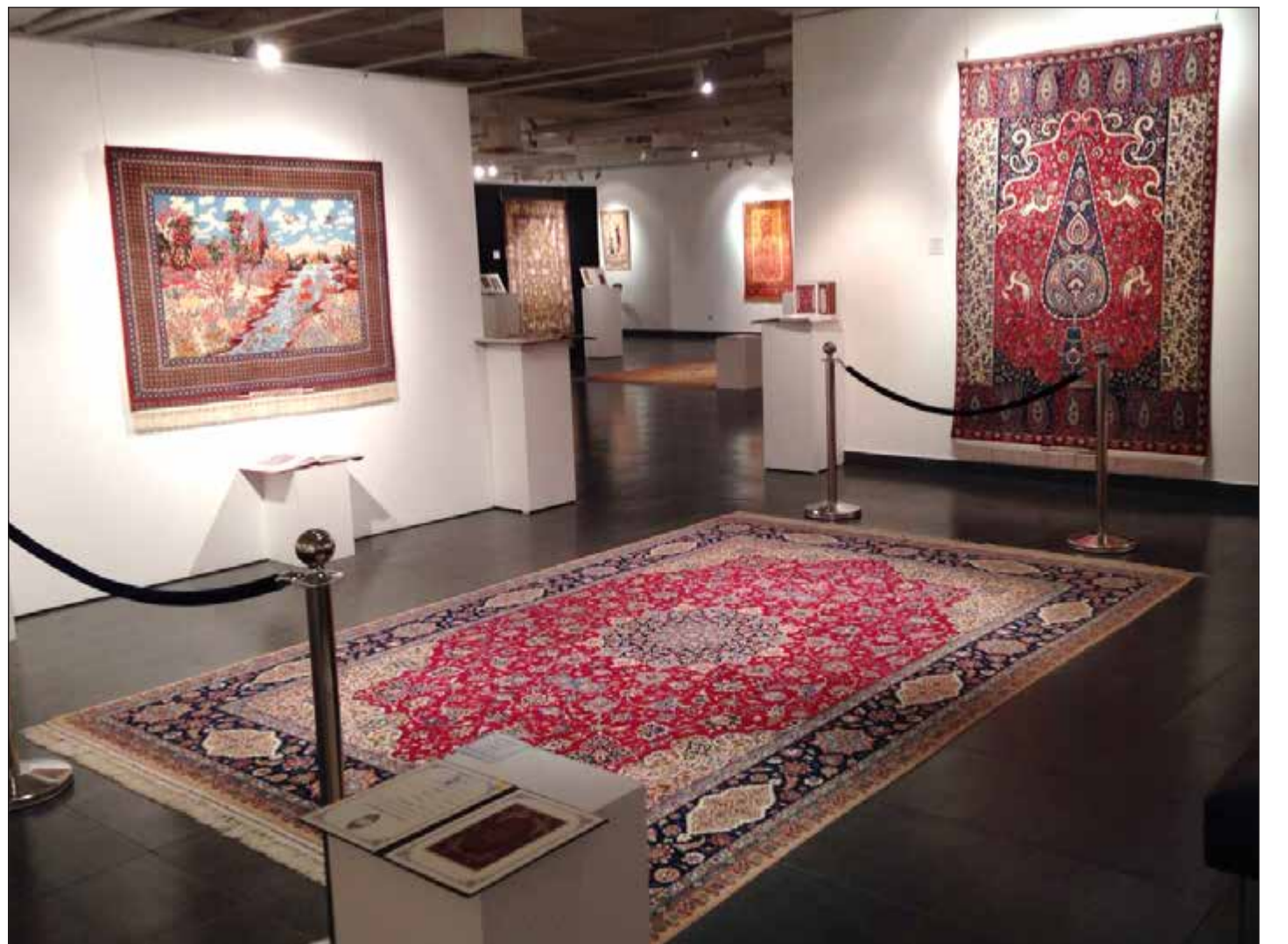
جانب من أندر أنواع سجاد صيرفيان في أحد معارض ميرزا