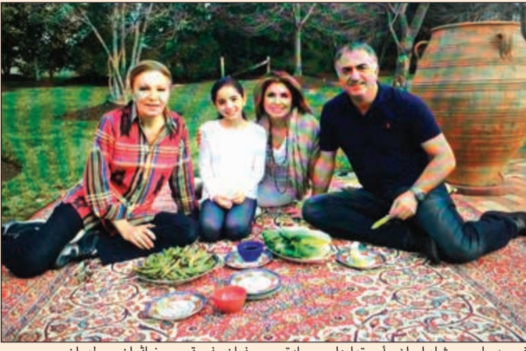
فرح ديبا حرم شاه إيران وأسرته على سجادة «صيرفيان» في قصر «نيافران» - طهران

عايدة ميرزا: أحرص على البحث عن أجود أنواع السجاد من خلال زيارتي للمعارض الدولية والمزادات العالمية للحصول على قطع نادرة ومميزة أنتقي منها السجاد بحرفية ومهنية عالية وأضمها إلى مجموعتي الفاخرة