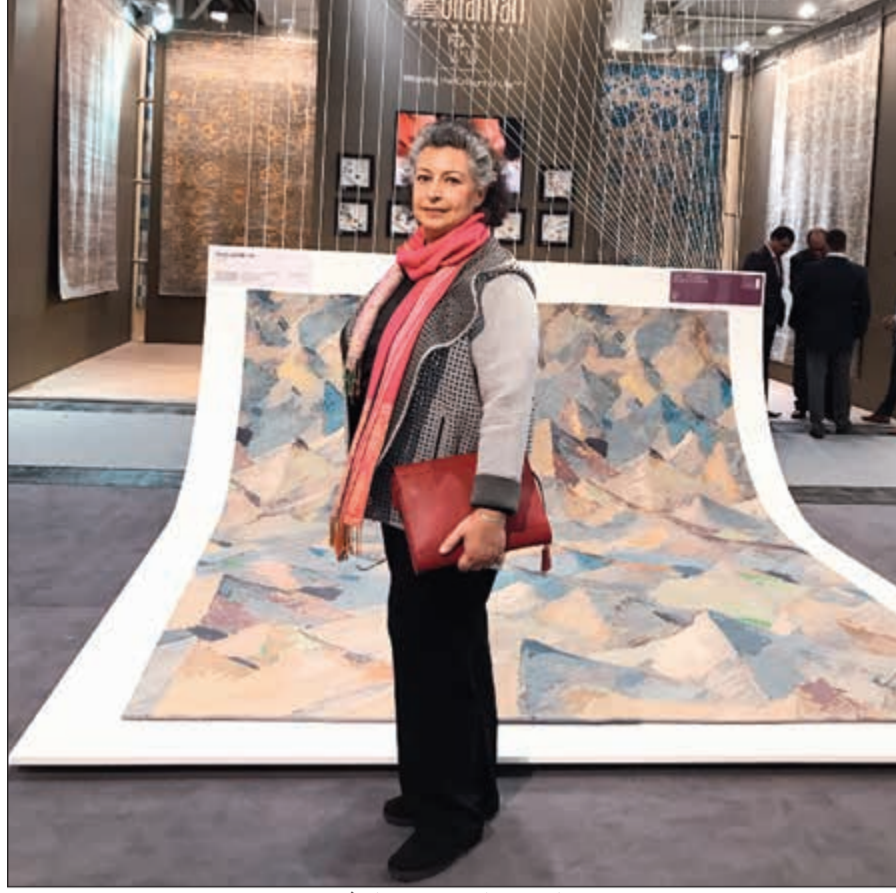
عايدة ميرزا في معرض هانوفر