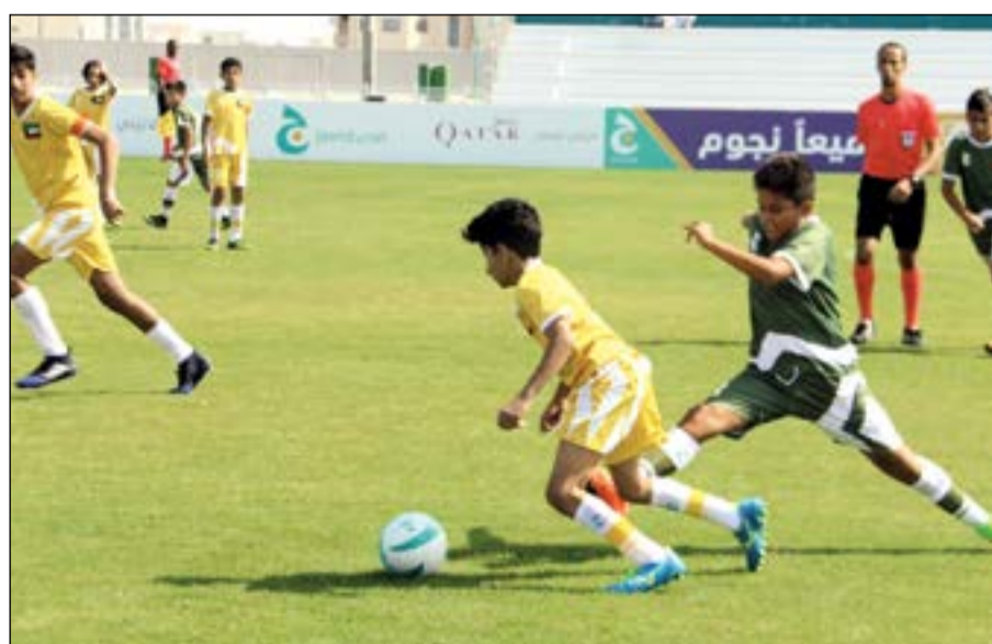
مروم مميز بالكرة أمام المدافع التشيلي

وبهذا الفوز تصدر منتخبنا للمدارس صدارة المجموعة الثالثة. وسيلتقي أزرق المدارس اليوم مع المنتخب السوداني.