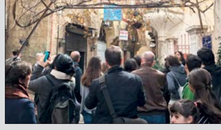
بذلك حاد، وعرضت الشابة لصورة طرابلس

التحقيق كامل على موقع «الأنباء» الإلكتروني www.alanba.com.