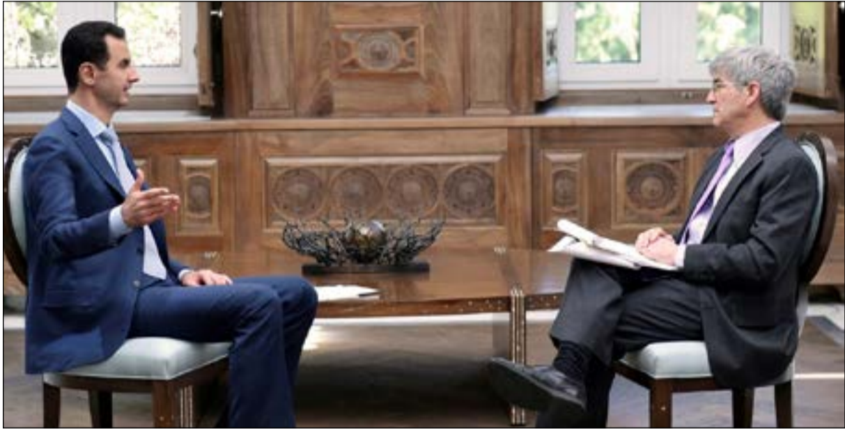
صورة نشرتها وكالة الأنباء السورية سانا، للرئيس السوري بشار الأسد خلال مقابله مع «ياهو» أمس (رويتور)

عواصم - وكالات: رفض الرئيس السوري بشار الأسد اقتراح الرئيس الأميركي دونالد ترامب إقامة مناطق آمنة للمدنيين داخل سورية.