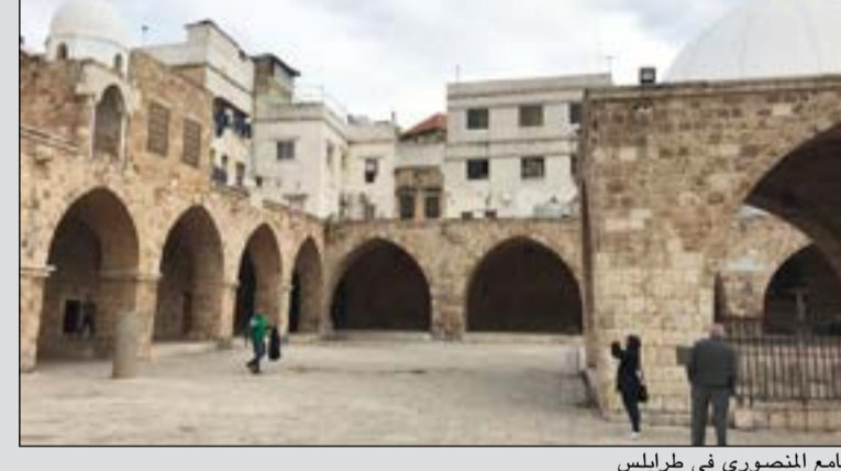
جامع المنصوري في طرابلس

مدينة للتعايش، شهدت «حروب الآخرين» واستمرت مدينة للتعايش والاختلاط أكثر من بيروت التي انقسمت إلى غربية وشرقية، على حد تعبيرها. بسرعة يتبدل المشهد بعد النزول من الحافلة في ساحة التل، وما هي عقارب الساعة تعود إلى الوراء، ربما إلى حقبة العثمانيين التي شهدت تشييد الساعة، والساحة التي كانت مقراً لسرايا طرابلس سابقاً. جولة سيراً على الأقدام بين الأزقة الصغيرة التي تخفي في دهاليزها تاريخ المدينة. وبوضوح يمكن ملاحظة حقبة المالكين والصليبيين والعمانيين. وفي مفارقة بين الأمس واليوم، نمر بمتجر «أ ب ث» المغلق، والذي توسع وانتقل إلى مدخل بيروت في ضبية (ساحل المتن) وفي قلبها بمنطقة الأشرافية، حيث مجمعين تجاريين راثنين يقصدهما اللبنانيون وأبناء الخليج على مدار السنة.