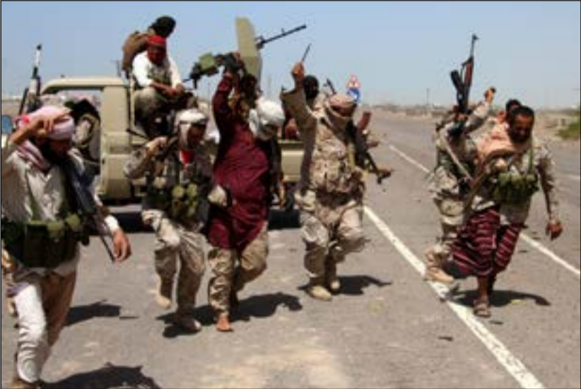
القوات الحكومية اليمنية تحتفل بالسيطرة على مدينة المخاء بعد أسابيع من المعارك مع الحوثيين