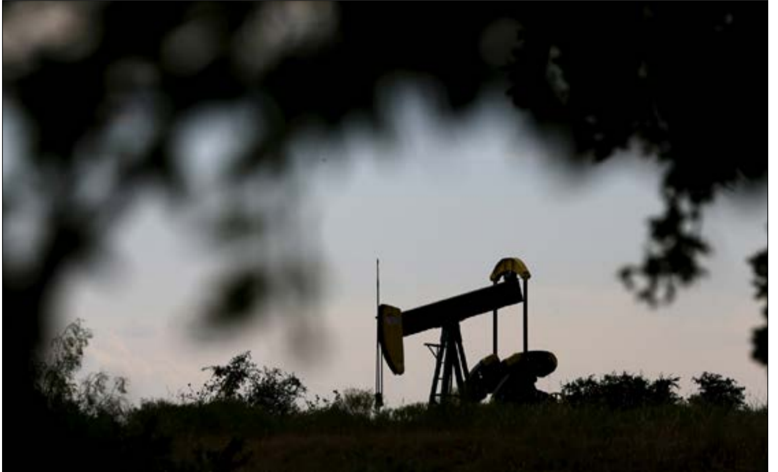
الزام قوي من أعضاء «أوبك» بتخفيض الإنتاج النفطي.. وفي الصورة منصة نفطية في ولاية تكساس الاميركية حيث يعود النفط الاميركي الى نشاطه مع ارتفاع اسعار النفط

رويترز: قالت مصادر في «أوبك» إن اللجنة الفنية المشتركة بين المنظمة والمعنية بمراجعة تنفيذ الاتفاق العالمي الخاص بتقليص الإنتاج ومنتجين مستقلين سيجمعون في 22 فبراير في فيينا ومجموعة المسؤولين المسماة باللجنة الفنية المشتركة ترشحها الدول الخمس التي