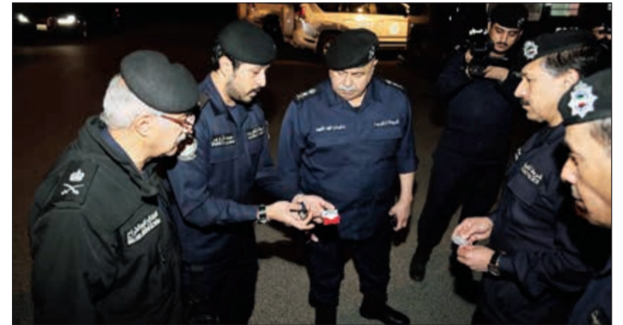
الفريق سليمان الفهد يعاين مخدرات مضبوطة ويبدو اللواء إبراهيم الطراح والعميد عابدين العابدين

المطلوبين وذلك بتعاون وتنسيق كامل مع هيئات ومؤسسات الدولة المعنية. وناشدت الإدارة العامة للعلاقات والإعلام الأمني والمقيمين على ضرورة التعاون مع رجال الأمن بعدم إيواء أو التستر على أي مخالف للقوانين أو مطلوب للعدالة تجنباً للوقوع تحت طائلة القانون، والعمل على دعم الحملات الأمنية من خلال سرعة الإبلاغ أو الإدلاء بالمعلومات حول أي أشخاص أو أعمال من شأنها الإضرار بأمن الوطن وأمان المواطنين والمقيمين، وطالبت الجمع حملات أمنية سوف تستمر وفق الواقع الميداني وما يتطلبه ذلك من إجراءات أمنية وقائية للقضاء على المخالفين لقوانين الإقامة