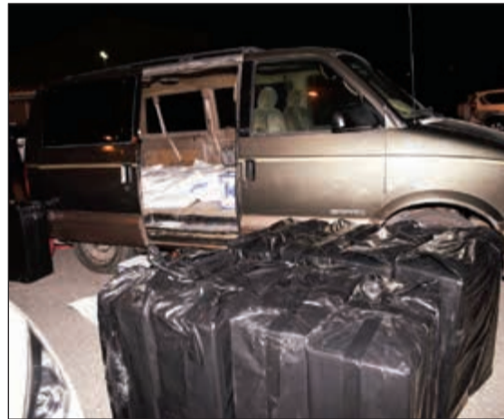
باص تحول الى وسيلة لنقل أدوات ومواد تصنيع الخمر المحلية