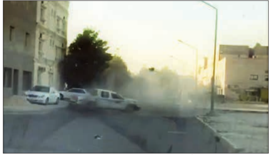
من المقطع الذي استغفر لجهزة الأمن

قال مصدر أمنى لـ «الانباء» ان بطل المقطع المصور الذي تضمن شخصا يستهتر بشكل مبالغ فيه حتى انقلبت السيارة الواجبت التي كان يمارس بها استهتاره ومن ثم عاد واستمر في وصلة الاستهتار هو شرطي في وزارة الداخلية وأنه تم العثور بحوزته على زجاجة خمر محلية، مشيراً الى ان المتهم تم التحفظ عليه في نظارة مخفر الفردوس أسوة بقية المحتجزين من النزلاء دون اي تمييز، لافتاً الى ان المتهم ستوجه إليه عدة تهم، منها تعريض حياة آخرين للخطر، واحتمالية قضية قيادة مركبة تحت تأثير السكر الدين، خاصة بعد ان أحيل الى الأدلة الجنائية لتحليل دمه