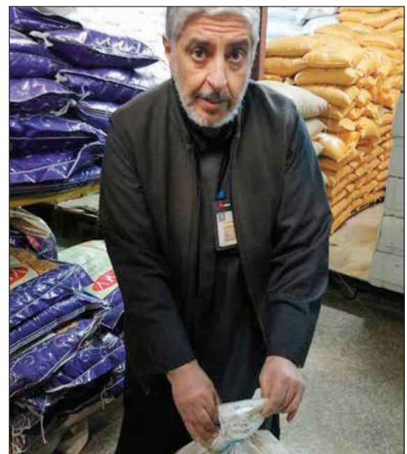
جانب من المضبوطات

كشفت إدارة العلاقات العامة في البلدية عن قيام قسم إزالة المخالفات بفرع بلدية العاصمة عن إتلاف 110 كيلو غرامات من المواد الغذائية وتحرير عدد 44 مخالفة.