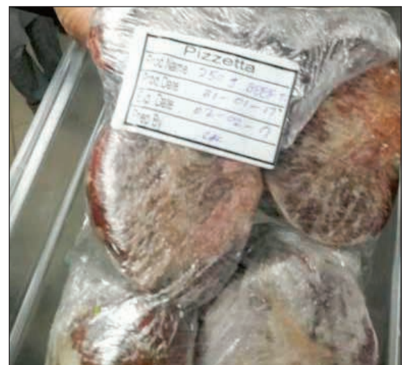
انتهاء تاريخ الصلاحية

ودعت إدارة العلاقات العامة ببلدية الكويت جميع المواطنين والمقيمين بعدم التردد بالتواصل عبر مواقع التواصل الاجتماعي للبلدية @kuwmun أو الاتصال بالخط الساخن (1844448) في حال وجود أي استفسار أو ملاحظة تخص العمل البلدي.