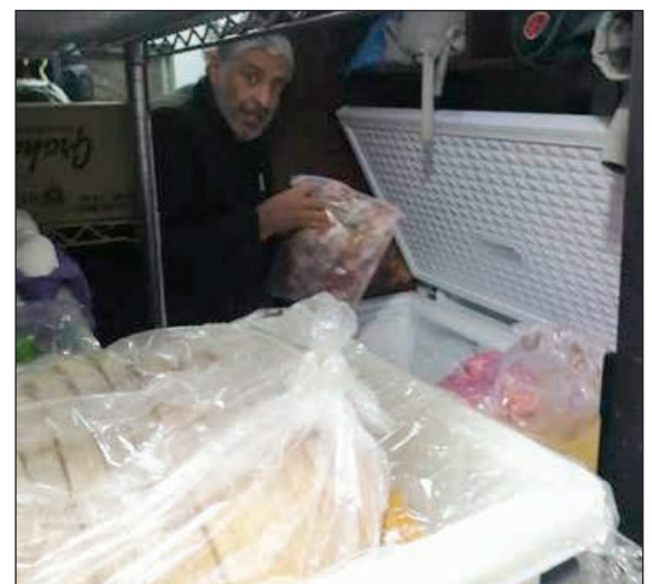
مواد غذائية غير صالحة