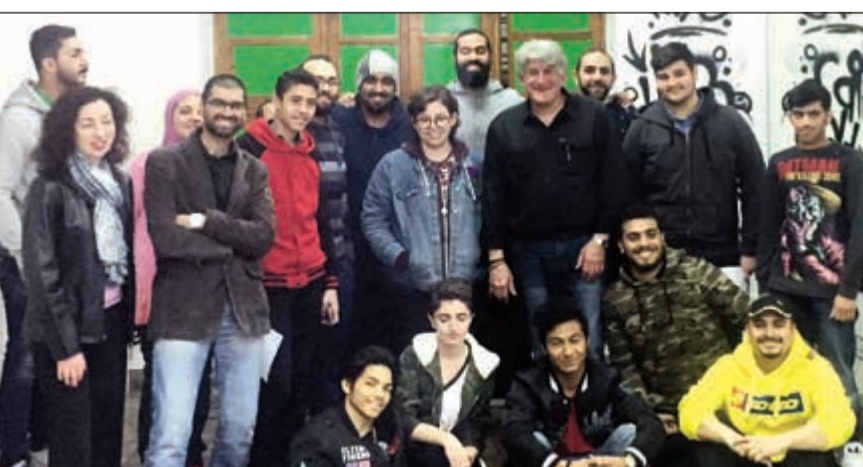
جانب من الطلبة المشاركين في ورشة العمل

وحصلت على خبرة رائعة في زيارتي الأولى، مؤكداً أن التمثيل المسرحي له نفس القواعد في أميركا والكويت، خصوصاً أن الممثل المميز له نفس النتائج على المسرح ومتعاونين خصوصاً أنها أول زيارة لي في الكويت