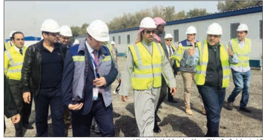
الشيخ مبارك السالم خلال جولته على ما تم إنجازه في المشروع

أعلن رئيس الإدارة العامة للطيران المدني الشيخ مبارك السالم أن أعمال مشروع مبنى الركاب المساند بمطار الكويت الدولي (مبنى الركاب رقم 2) ستنتهي في شهر نوفمبر المقبل.