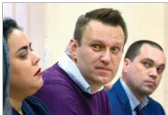
المعارض الروسي اليسكي نافيالى

موسكو - وكالات: حكمت محكمة روسية على المعارض اليسكي نافيالى أمس بالسجن خمس سنوات مع وقف التنفيذ بتهمة اختلاس أموال في القضية التي أعادتها المحكمة العليا إلى المحكمة الابتدائية. وكان حكم مماثل صدر بحق نافيالى في محاكمته الأولى ونددت به المحكمة الأوروبية لحقوق الإنسان واعتبرته «تعسفياً» و«له طبيعة سياسية». ورغم أن وكالة إنترفاكس للأخبار ذكرت أن الحكم سيجبر زعيم المعارضة نافيالى على التراجع عن عزمه الترشح في انتخابات الرئاسة المقررة العام المقبل، باعتباره سيصبح غير مؤهل لخوض الانتخابات بموجب القانون. لكن نافيالى أكد فور صدور الحكم بحقه أنه يبقى مرشحاً للانتخابات الرئاسية الروسية في العام 2018. وقرر القاضي في محكمة كيروف ادانة نافيالى بتهمة الإخلال بحكم عليه بالسجن خمس سنوات مع وقف التنفيذ. وحكم على