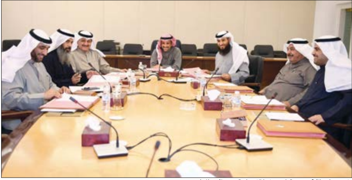
رئيس مجلس الأمة مرزوق الغانم مترسدا الاجتماع الدوري لمكتب المجلس

مع بشارت عهد جديد مشرق بطلائع اليمن والأزدهار ومع تزامن اعتلاء سموكم ولاية العهد في عامها الحادي عشر الذي أشرق بنور وضيء في سماء الكويت العز والمجد فإنه ليسعدني أن أرفع إلى مقام سموكم الكريم باسمي ونيابة عن إخواني أعضاء مجلس الأمة تحية إكبار وإجلال واقتدار على ما أسديتموه لشعبكم الوفي وللوطن خلال مسيرة سموكم الخيرة والمغفمة بأسمى معاني الحب والوفاء لاهل الكويت الحافلة بالعطاء المتواصل والتفاني في خدمة الوطن الغالي وشعبنا العزيز، مستذكراً بكل فخر وتقدير واعتزاز هذه المناسبة الغالية والعزيرة على نفوسنا جميعاً، ومجديدين العهد والوفاء لسموكم في المضي قدماً في طريق الإصلاح والتقدم والأزدهار، وأن تبقى باذن الله