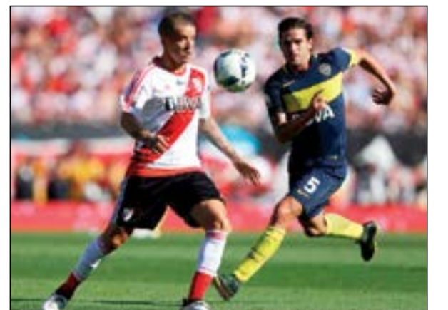
بوكا وريفر بليت خلال مباراة سابقة