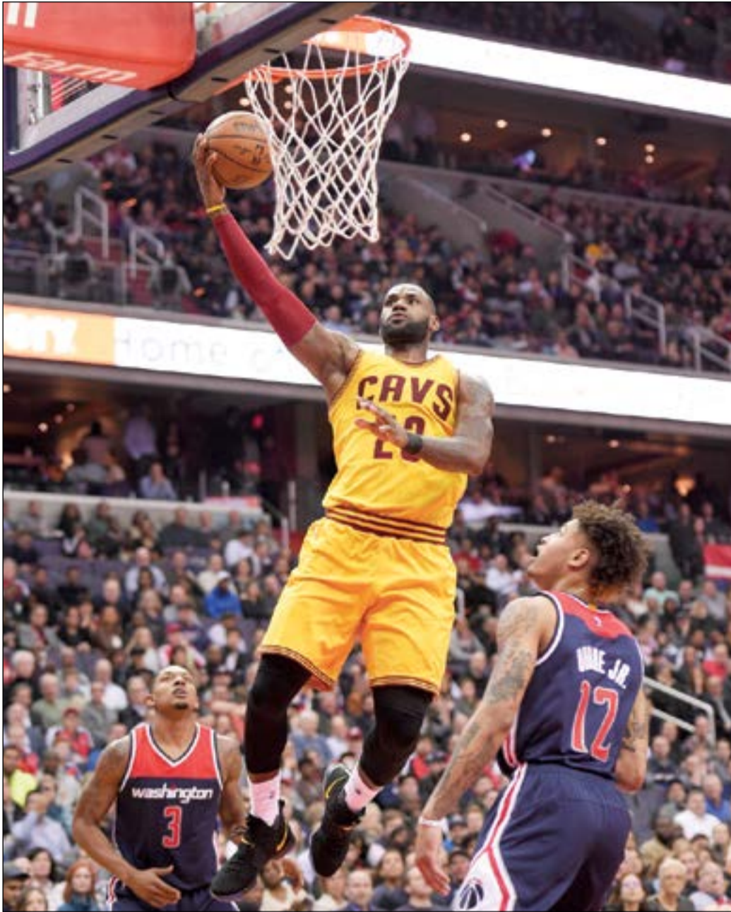
العلاق ليبرون جيمس ينتفض

واصل كليفلاند كافاليرز حامل اللقب صحوته بفوزه الصعب والثمين على مضيفه واشنطن ويزاردز 140-135 بعد التمديد في دوري كرة السلة الأميركي للمحترفين.