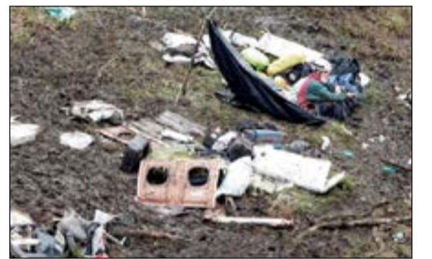
حطام الطائرة المتكوية