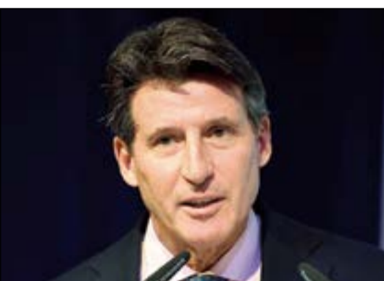
رئيس الاتحاد الدولي لألعاب القوى

عائلة ألعاب القوى قبل نوفمبر 2017 على الأقل. وجاء تصريح البطل الأولمبي السابق في سياق 1500م (1980/ 1984) عقب مصادقة مجلس الاتحاد الدولي على توصية لجنة العمل القاضية بتمديد عقوبة استبعاد روسيا الموقوفة منذ نوفمبر 2015، عن المشاركة في المسابقات الدولية. وتم تمديد العقوبات بحق روسيا في مارس ويونيو الماضيين ما أدى إلى حرمان