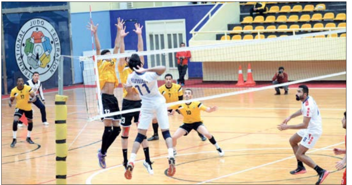
الابيض في مواجهة سابقة في البطولة