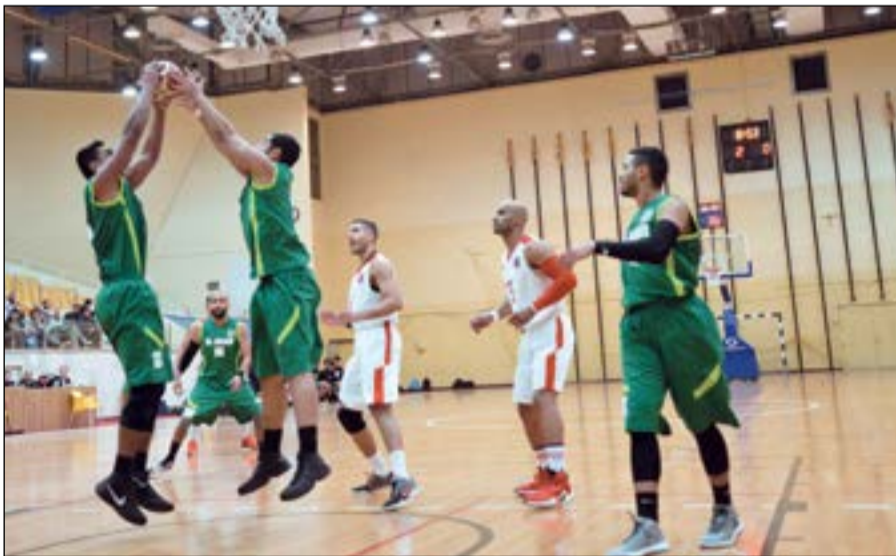
مباريات دور الستة ستكون أكثر إثارة

اتحاد اللعبة في البلاد لعقوبات كبيرة. وخاطب مجلس الإدارة وزارة الداخلية لتوفير الأمن خلال المنافسات والتي ستكون قوية بين الفرق الستة التي تسعى للحصول على لقب الدوري. وقامت الإدارة بتشكيل اللجان العاملة في مهرجان العيد الوطني والمباراة الاستعراضية، كما يتم التنسيق حالياً لتنظيم أول مهرجان للصغار «ميني باسكت» في 17 الشهر الجاري. إلى ذلك، تقام اليوم المباراة المؤجلة بين الكويت والصليبيات في صالة نادي الكويت عند الساعة السادسة مساءً.