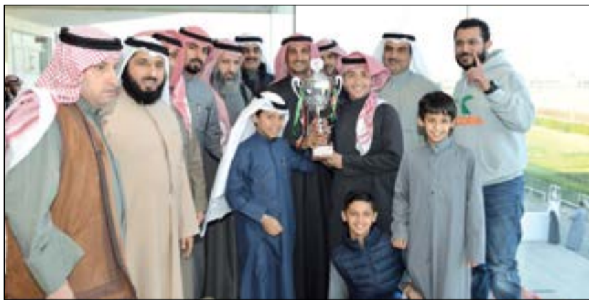
أسرة الجواد «الغيث»، فرقة بالكاس