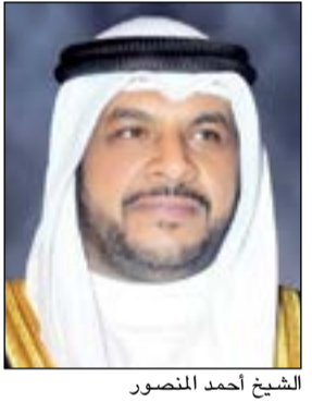
الشيخ أحمد المنصور

الهيئة تشيد بجهود الحمود أشادت الهيئة العامة للرياضة في بيان لها يوم أمس بالجهود المخلصة التي قام بها وزير الإعلام ووزير الدولة لشؤون الشباب ورئيس مجلس إدارة الهيئة السابق الشيخ سلمان الحمود لارتقاء بالحركة الشبابية والرياضية. وأكد مجلس إدارة الهيئة وجهازها التنفيذي في بيان