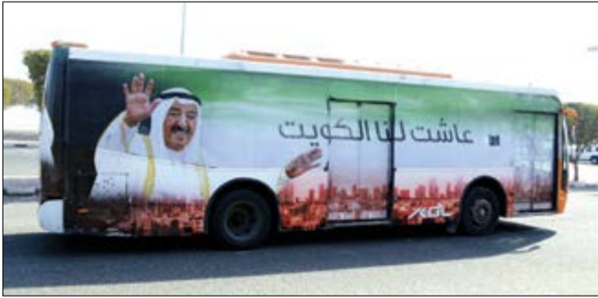
حفلات «كي جي إل» تحتفل بالأعياد الوطنية