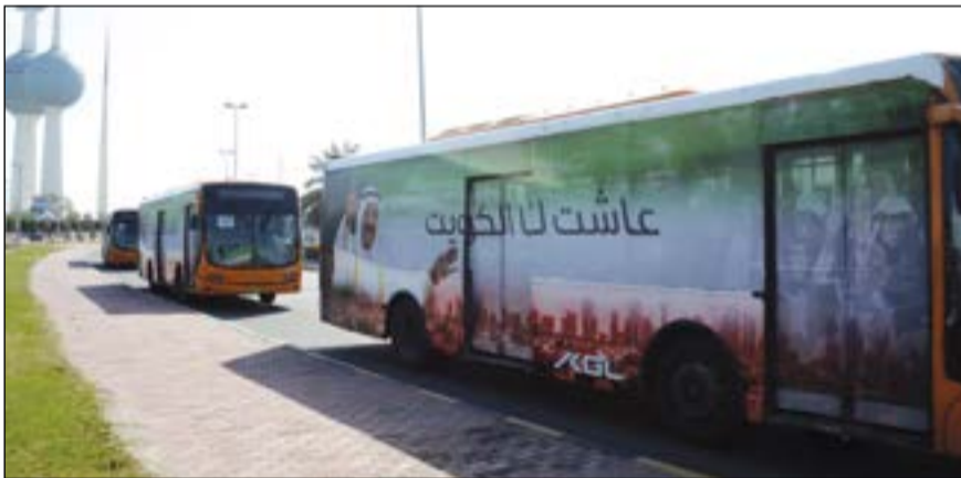
مشاركة وفرحة بالأعياد