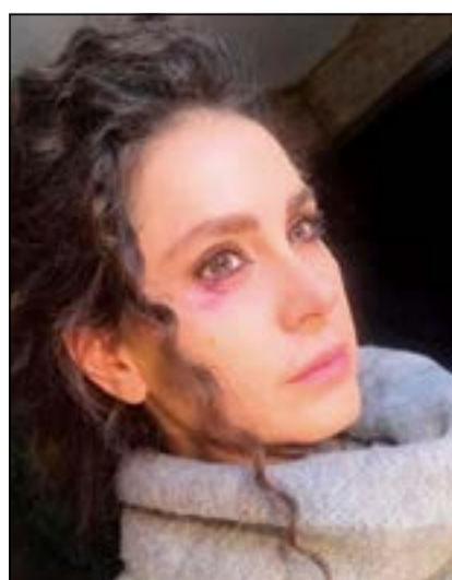
ديمة مشوهة الوجه