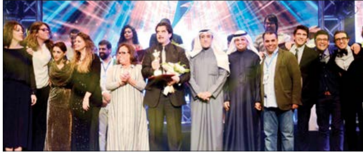
صورة من ختام الدورة السابقة للمهرجان