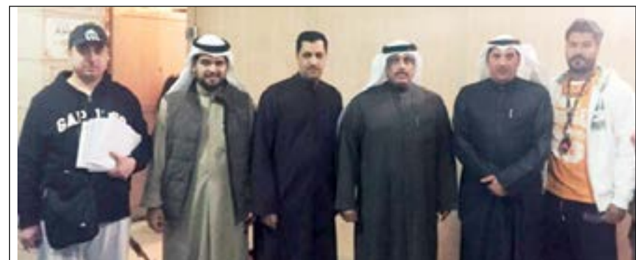
فريق «التجارة» المشارك في الضبطية

أكد الوكيل المساعد لقطاع الرقابة التجارية وحماية المستهلك عبد الرشيد في الوزارة تمكنت من ضبط أكبر عملية غش تجاري لتقليد العطور في الكويت. وأضاف الرشيد في تصريح لـ «الأنباء» أن المحل مشهور وكائن في منطقة الفروانية وأن كميات العطور يبلغ عددها بألاف الزجاجات. وبين أن المحل لديه العديد من المخازن بالإضافة إلى شقة ومصنع كائن بالقرب من المحل حيث تتم تعبئة العطور وتجهيزها في المخازن في هذه الزجاجات التي تحمل اسم ماركات عالمية مشهورة تمهيداً لبيعها بأسعار عالية لتحقيق مبالغ مالية كبيرة بطرق تخالف القانون. وأشار إلى أنه أعطى تعليمات لفريق طوارئ الصديق لقطاع الرقابة التجارية وحماية المستهلك لضبط المحل في الساعة 12 ونصف من صباح أمس. ولفت الرشيد إلى أن المفتشين قاموا منذ فترة بمراقبة المحل، مبيناً أن صاحب المحل كان يطلب من العمال القيام بعملية التقليد بشكل محترف جداً لا يمكن كشفه بسهولة. وأوضح أن مفتشي الوزارة تحفظوا على الكميات المضبوطة من العطور والأدوات التي تجهز بها وتم إعداد محضر ضبط لصاحب المحل تمهيداً لنحويله للجنة المحاضر في الوزارة والتي بدورها تحيل المحضر إلى النيابة التجارية لاتخاذ