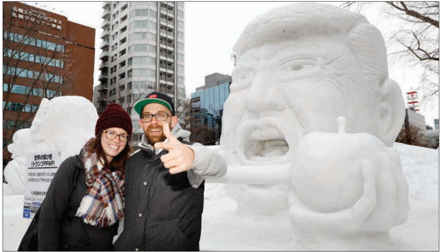
سائحون يلتقون صورة تذكارية أمام تمثال من الثلج لترامب شمال اليابان أمس