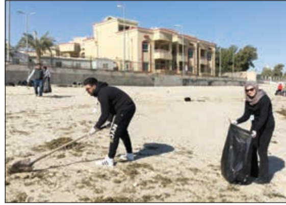
جانب من تنظيف الشاطئ