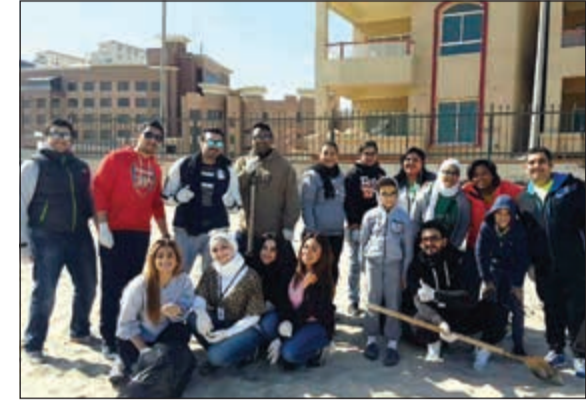
من المشاركين في حملة تنظيف الشاطئ بالتعاون مع «لويك»