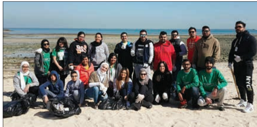
لقطة تذكارية للمشاركين بالحملة

ضمن خطة مسؤوليتها الاجتماعية وفي ظل تطبيق وتعزيز مبادئ حوكمة الشركات، نظمت الشركة التجارية العقارية حملة تنظيف الشاطئ بمشاركة متطوعين من موظفيها وموظفي شركاتها التابعة والرسمية وبالتعاون مع لويك، وذلك يوم السبت 4 الجاري على شاطئ مجمع داين زون - الفنطاس، حيث شارك في الحملة أكثر من 30 متطوعاً من مختلف الأعمار مجهزين بالأدوات اللازمة التي تضمنت قفازات بلاستيكية وأكياسا قمامة ومعدات جمع الأوساخ، وتم بنجاح وبالتعاون مع لويك المتطوعين جمع أكثر من 20 كيس قمامة.