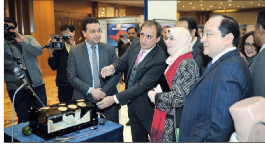
..وتتابع إحدى التقنيات الحديثة

جميعاً، مشيرة إلى أن رعاية صحتها المرأة تأتي في قمة أولويات وبرامج الوزارة عن الصحة التي نتقاسمها