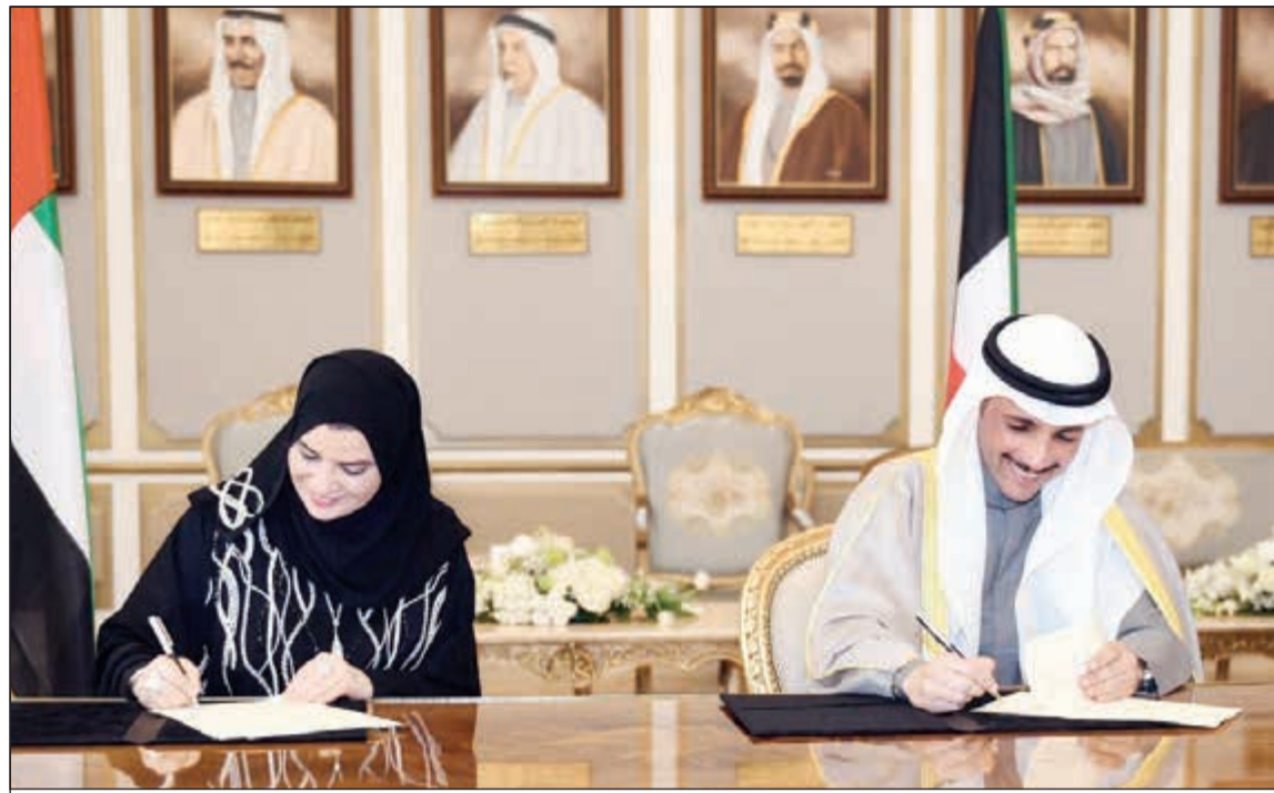
رئيس مجلس الأمة موزون الغانم خلال توقيع ونظيره الإماراتية اتفاقية تعاون ثنائية