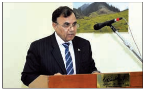
السفير الباكستاني غلام دستجير يتحدث (عادل سلامة)

إلى باكستان، موضحا أن إحياء ذكرى يوم كشمير يهدف إلى تجديد المساندة الأخلاقية والديبلوماسية والسياسية لقضية كشمير ولكفاح شعبها المشروع من