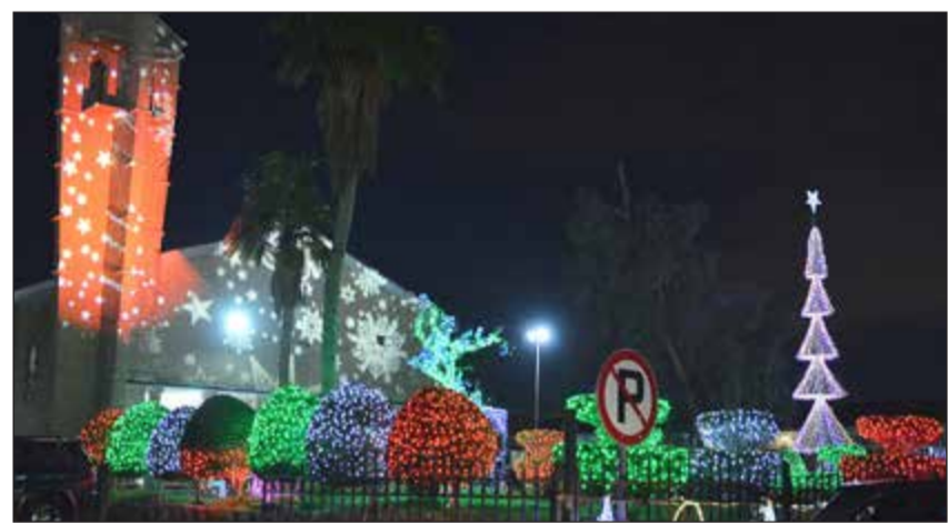
الأحمدي تتلألأ بالأضواء احتفالا بالأعياد الوطنية

رفع أعلام الكويت ودول مجلس التعاون وإطلاق فريق من أبناء وبنات مدارس منطقة الأحمد التعليمية الأمازيغ والصباحات والأغاني الوطنية.