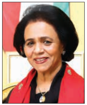
الشيخة فريحة الأحمد

وذكرت أن الإسلام دين التسامح والرحمة والعمق الذي ينبذ كل أشكال العنف، مشيرة إلى الدور الذي لعبته الحضارة الإسلامية في التاريخ الإنساني ومفومات الحياة الكريمة التي يتضمنها الإسلام والمعاني النبيلة الفياضة والمشاريع العظيمة التي يدعو إليها.