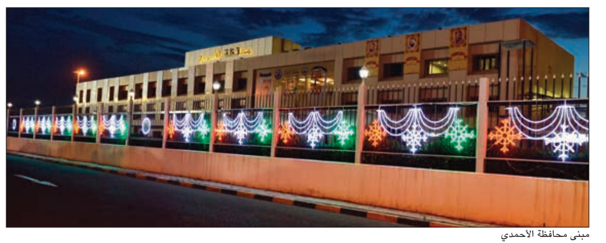
مبنى محافظة الأحمدية