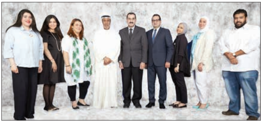
فريق الكلية المشارك في المسابقة