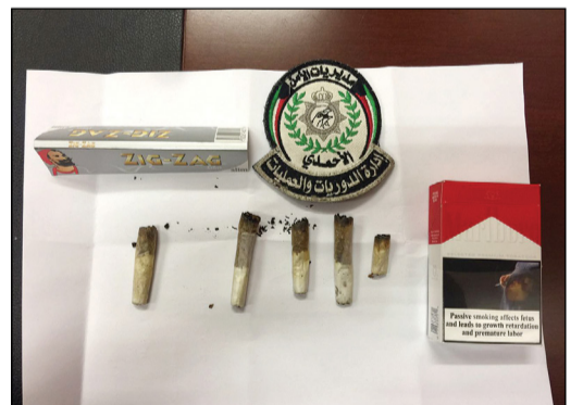
المواد المخدرة التي عثر عليها مع مطلوبين الفنتاس