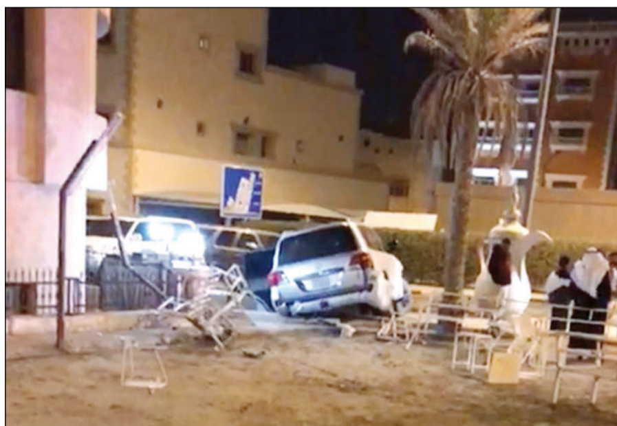
المركبة التي اقتحمت المنزل في منطقة سعد العبدالله