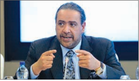
الشيخ أحمد الفهد

أشاد الشيخ أحمد الفهد رئيس اتحاد اللجان الأولمبية الوطنية (انوك) باللجنة الأولمبية الأميركية على العمل الذي قامت به لضمان مشاركة الرياضيين والمسؤولين الرسميين في الأحداث الرياضية الدولية في الولايات المتحدة. وقال الفهد في بيان له نيابة عن انوك: انوك تتخني على العمل الذي قامت به اللجنة الأولمبية الأميركية مع حكومة بلادها لضمان دخول الرياضيين والرسميين من جميع أنحاء العالم الى الولايات المتحدة للمشاركة في الأحداث الرياضية الدولية. ان الولايات المتحدة هي شريك مهم للحركة الأولمبية وتستضيف بانتظام أحداثا دولية، ولذلك فإن هذه المبادرة مهمة. وتابع: الرياضة لديها القدرة على توحيد العالم وعمل اللجنة الأولمبية الأميركية هو مثال آخر على العمل الممتاز الذي تقوم به اللجان الأولمبية الوطنية حول العالم لحماية والترويج للقيم الأولمبية.