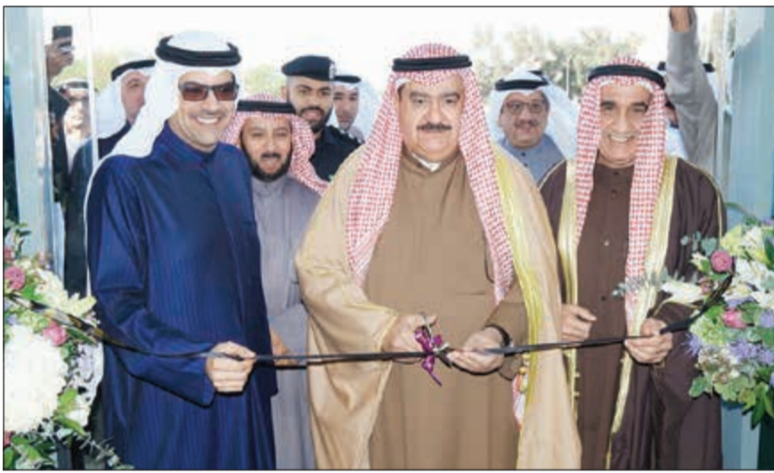
المهنا والتامض يقصان شريط افتتاح الفرع

قال محافظ العاصمة الفريق متقاعد ثابت المهنا إن بيت التمويل الكويتي (بيتك) يستحوذ على ثقة المجتمع نتيجة الأداء المتميز والنجاح الكبير في تقديم مجموعة متنوعة من الخدمات التي حازت رضا شريحة واسعة من الكويتيين ووفرت العديد من الاحتياجات اليومية والأساسية لشريحة كبيرة منهم، مشدداً خلال افتتاحه فرع «بيتك» في منطقة اليرموك على أهمية الاستمرار في تدعيم هذه الثقة بالالتزام والتطوير وتحقيق قيمة مضافة للمجتمع بالنشطة ومساهمات في المجالات المختلفة.