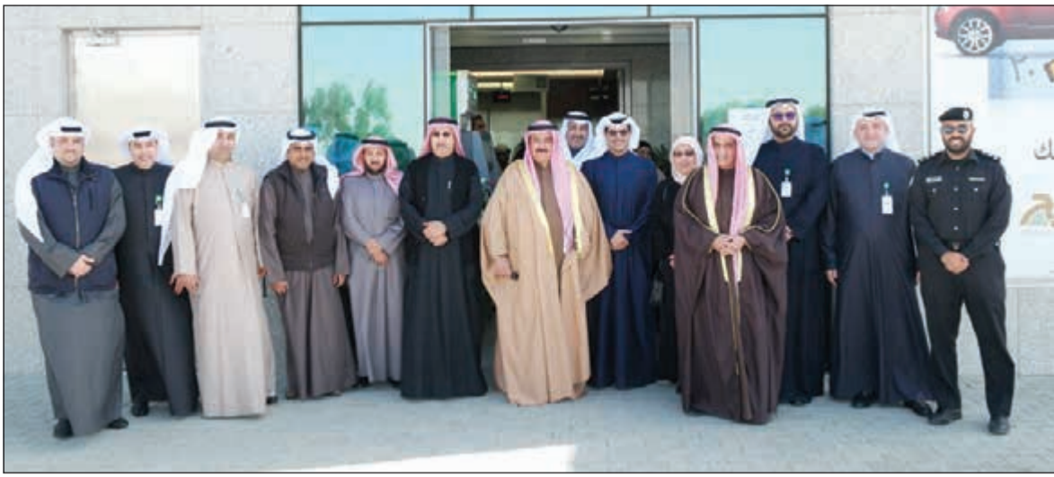
صورة جماعية للمشاركين في الافتتاح