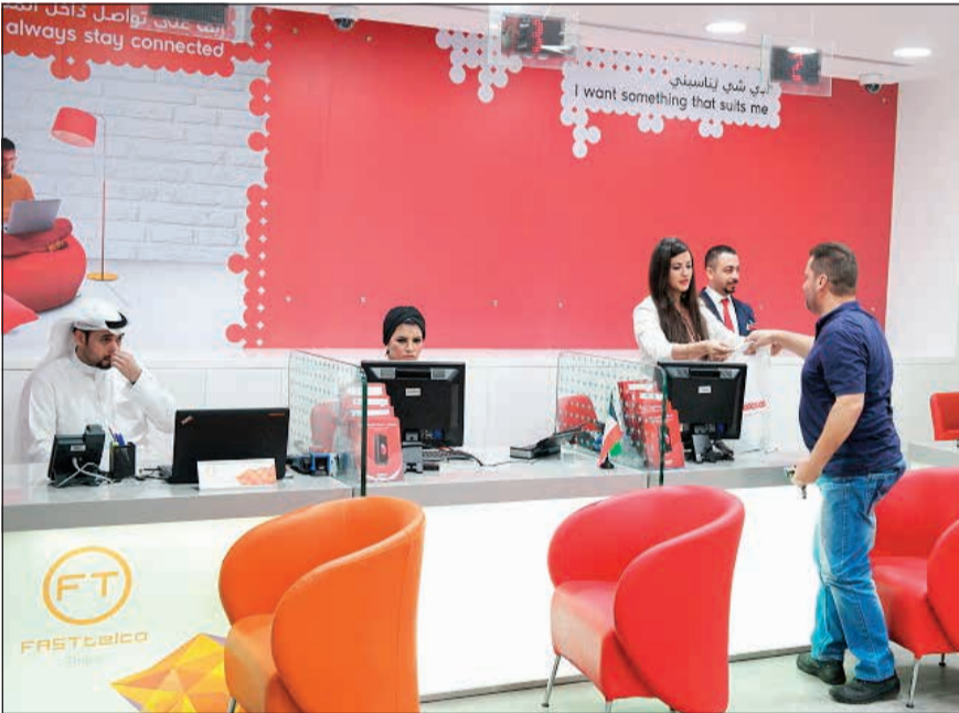
خدمات مختلفة للعملاء على مدار الساعة طوال أيام الأسبوع

افتتاح أفرع جديدة خلال الفترة المقبلة ضمن خططها للتعاون مع مجموعة الاتحاد مناطق الكويت كافة. واستطاعت Ooredoo منذ بدايتها خطة التوسع في 2014 زيادة عدد أفرعها بأكثر من 70 فرعاً حول الكويت.