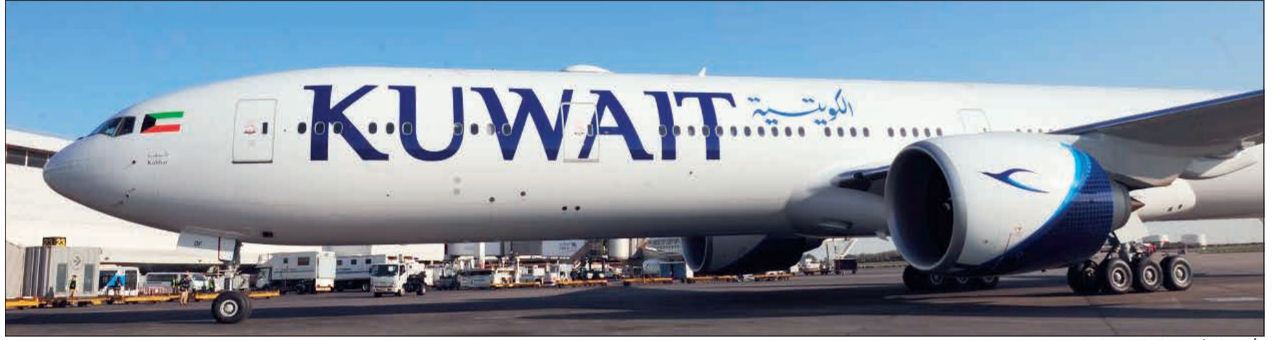
«كبر» على أرض مطار الكويت الدولي

الرابعة «كبر» من مصنع بوينغ، وستتسلم باقي طائراتها من طراز بوينغ 300ER-777 ضمن الجدول الزمني الموضوع، ليدخل كل الأسطول في الخدمة خلال الربع الثالث من العام 2017، ما سيعزز من فاعلية خططنا التوسعية التي تشمل تعزيز أسطولنا، الذي ستضم إليه طائرات إيرباص بواقع 10 طائرات من طراز A350 و 15 طائرة من طراز A320neo وسبدا استلامها في عام 2019.