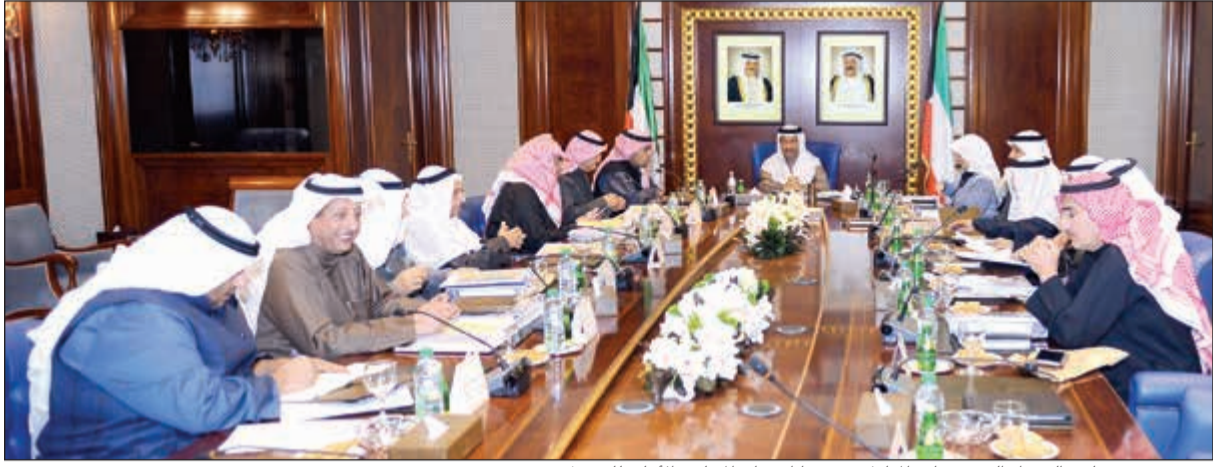
سمو رئيس مجلس الوزراء الشيخ جابر المبارك مترشحا لاجتماع المجلس الأعلى للبترول

كشف وزير النفط ووزير الكهرباء والماء م. عصام المرزوق عن أن المجلس الأعلى للبترول قرر بالإجماع إلغاء مناقصة شركة نفط الكويت لتوريد خطوط أنابيب لتغذية مشروع مصفاة الزور باللقيم اللازم من النفط الخام والغاز الطبيعي. وقال المرزوق في بيان صحافي أمس إن «الأعلى للبترول» عقد اجتماعا لمناقشة البنود المدرجة على جدول أعماله واطلع على كتاب رئيس مجلس إدارة الجهاز المركزي للمناقصات العامة المؤرخ في 31 يناير 2017 بشأن مناقصة الأنابيب، وقد بحث المجلس الأعلى للبترول جميع المعطيات المتعلقة بهذا الأمر وبعد الاستماع إلى وجهات نظر المعنيين في القطاع النفطى والبدايل المتاحة في هذا الخصوص، فقد قرر المجلس بالإجماع إلغاء المناقصة. وأشار إلى أن المجلس الأعلى للبترول اطلع على خطة القطاع النفطى لتزويد مصفاة الزور باللقيم اللازم لتشغيلها في الوقت المحدد لها دون تأخير، المتوقعة في استغلال خطوط الأنابيب الموجودة حاليا بين