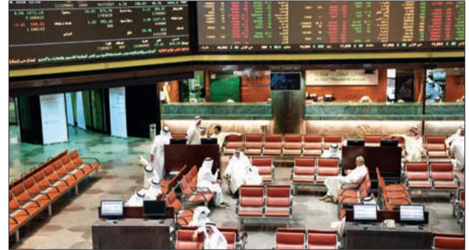
جني الأرباح يغود مؤشرات وسيولة البورصة للتراجع

أظهرت حركة ملكية كبار الملاك أمس، استحواد شركة اكتاب القابضة ومجموعتها (شركة بترو للأعمال المتكاملة) على نسبة 5,3٪ من أسهم شركة المدينة للتمويل حسب موقع البورصة. وتقدر قيمة هذا الاستحواذ بـ1,3 مليون دينار. كما استحوذت شركة أثمان الوطنية للتجارة العامة على بنسبة 7,02٪ من أسهم شركة وثاق للتأمين بقيمة بلغت 464 ألف دينار، وزادت «أثمان» حصتها في شركة سنام العقارية بنسبة 1,9٪ لتصل إلى 17,9٪ وبلغت قيمة الاستحواذ 127 ألف دينار.