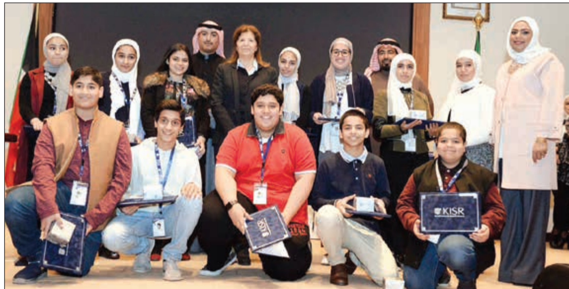
لفتة تذكارية في ختام الدورة التدريبية الـ 29