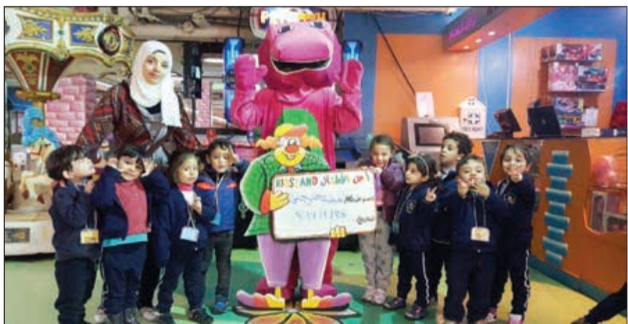
براعم حضنة ترحب في «أرض الأطفال»

استعدت أرض الأطفال الرائدة بالألعاب الترفيهية والتربوية بالكويت لمجموعة من الفعاليات والبرامج الجديدة والمتنوعة التي تناسب الأطفال، وتنمي قدراتهم ومواهبهم، وتشجعهم على اللعب الجماعي بما يدخل الفرحة والبهجة إلى قلوبهم من خلال توفير الألعاب الشائقة بأنواعها المختلفة، بالإضافة إلى أنه تم وضع آلية جديدة من خلال برنامج خصومات داخلية بفروع الشركة في كل من مجمع الأوقاف بشرق وجمع مغاير بالفروانية والخيمة مول والعالمية مول بالجهراء، بمناسبة العودة إلى المدارس وكذلك العروض على المهرجانات الخارجية، وأعياد الميلاد الخارجية. وفي السياق ذاته، تقيم أرض الأطفال حفلات للاطفال بمجمع الأوقاف في أوقات متفرقة لتلبية رغبات الاطفال وكذلك سيكون هناك برنامج ممتع وهدايا خاصة بجميع فروع الشركة المنتشرة بالكويت. وجدير بالذكر أن أرض الأطفال استحدثت مجموعة من الألعاب الهوائية كالنطاطيات والزحلاقيات، والمائية كملعب الصايون استعدادا لموسم الاجازات للتمتع بتلك الخدمة داخل المنازل، بالإضافة تعيين فريق كامل ومتمرس ومدرب للمحافظة على سلامة الاطفال من المخاطر.