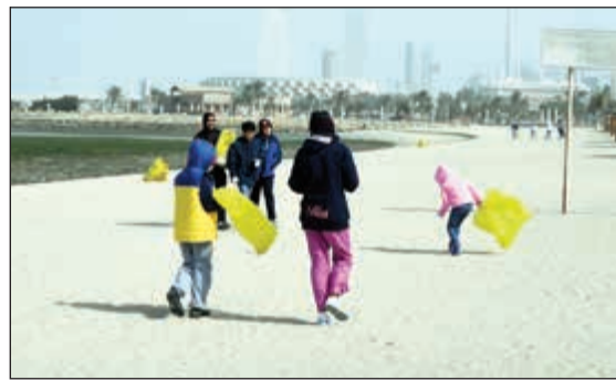
جانب من عملية التنظيف