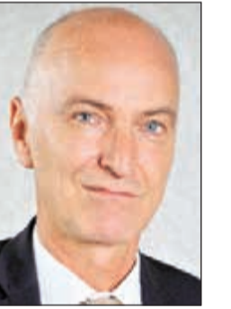
د. كلاوس بيكر

يستضيف ملتقى شركات التأمين المزمع عقده 19 فبراير في شيراتون الكويت مستشار الهيئة الوطنية للضمان والتأمين الصحي لدى حكومة الإمارات العربية المتحدة «ابوظبي» د. كلاوس بيكر. وقد عمل بيكر في السابق، مستشاراً لمختلف الوزارات والجهات الحكومية في الكويت والمملكة العربية السعودية، وأوروبا في مجالات الرعاية الصحية، والتمويل، ويعتبر أحد الرواد والمخططين الاستراتيجيين في مجال عمل قطاع التأمين وهندسة البرامج والحلول التأمينية للضمان الصحي. وسيقدم بيكر ورشة عمل محورية مهمة على هامش المؤتمر عن: