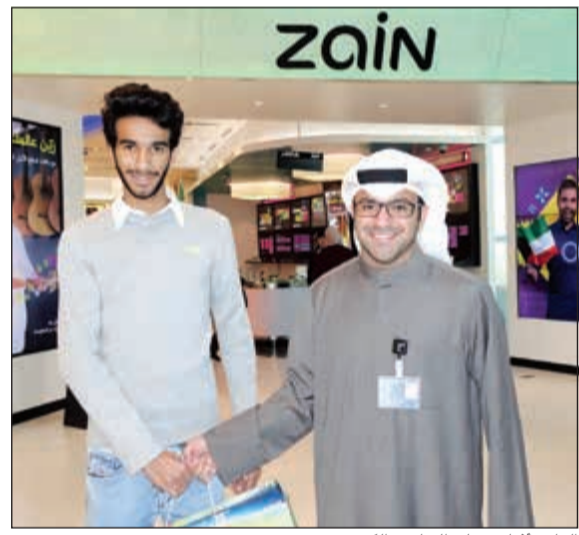
الفائز أثناء تسلم الجائزة الكبرى

طريق تطبيق زين للهواتف الذكية، وبينت زين أن هذه الحملة أتت في إطار سلسلة حملاتها التي تمنح الفرصة لعملائها من ذوي الدفع الأجل للفوز بجوائز قيمة، مشيرة إلى أنها تحرص على خدمة عملائها بأحدث الوسائل والطرق وأكثرها سهولة وأماناً، والتي تشمل موقع الشركة الإلكتروني وتطبيقها للهواتف الذكية المتوافر على نظامي الـ iOS و Android. وأكدت الشركة أنها ستعمل باستمرار على صياغة العديد من المنتجات والخدمات التي تتقابل مع طموحات وتوقعات عملائها، وفي ذات الوقت فإنها تعمل على تكثيف جهودها نحو طرح أحدث العروض والخدمات المتكاملة للمحافظة على المكانة الرائدة التي وصلت إليها.