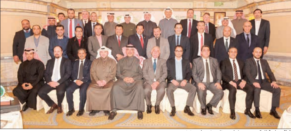
لقطة جماعية للمكرمين ومسؤولي «بيتك» يتوسطهم مندني

كبيراً وأصبحت مثقالاً يحتذى، مضيفاً أنه في نهاية عام من العمل والأداء المتميز، كان من المهم أن نحكي جهود «شركائنا في النجاح» ونشكرهم على تعاونهم، ونؤكد أننا بهذه الروح الطيبة قادرون على مواجهة وتجاوز المصاعب التي لا يخلو منها أي سوق. وأشار مندني إلى أن عام 2016 مثل تحدياً حقيقياً للعاملين في مجال السيارات، لتحقيق أفضل مستوى ممكن لتشغيلية صعبة، معرباً عن الأمل أن يكون عام 2017 أكثر نمواً ونجاحاً بزميد من التعاون والتنسيق المشترك بين جميع عناصر السوق، حيث يعمل «بيتك» بروح من التعاون والاهتمام ورؤية ترى أن سلامة الأداء وتكامل الجهود يخدم مصلحة الجميع مع «بيتك» خلال عام 2016.