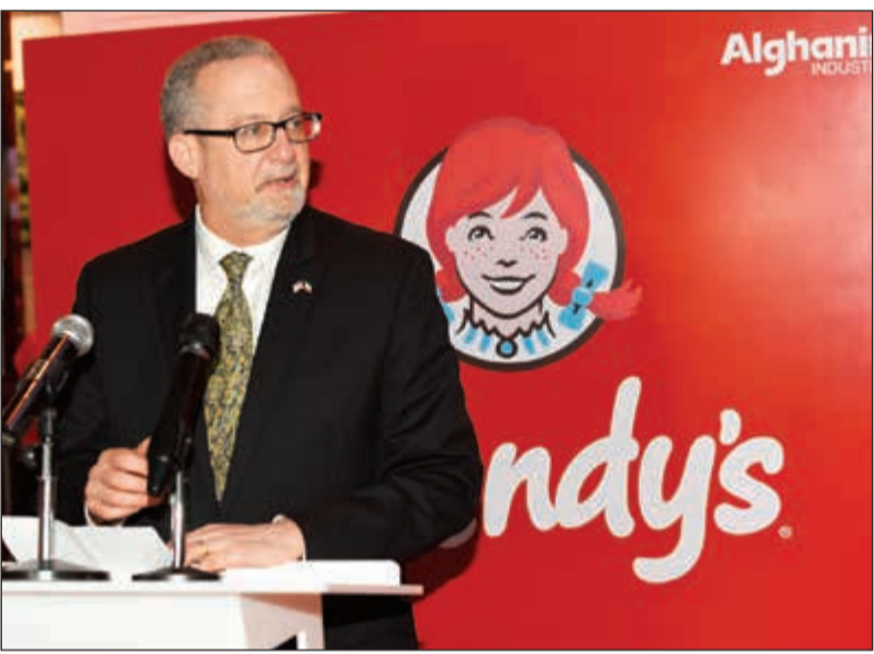
السفير الأميركي لورانس سيلفرمان يلقي كلمته