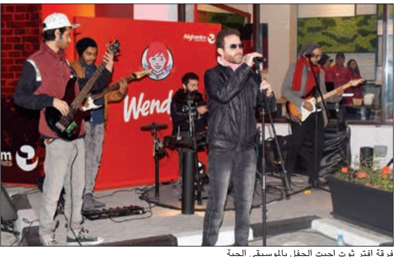
فرقة افتر ثوت احييت الحفل بالموسيقى الحية