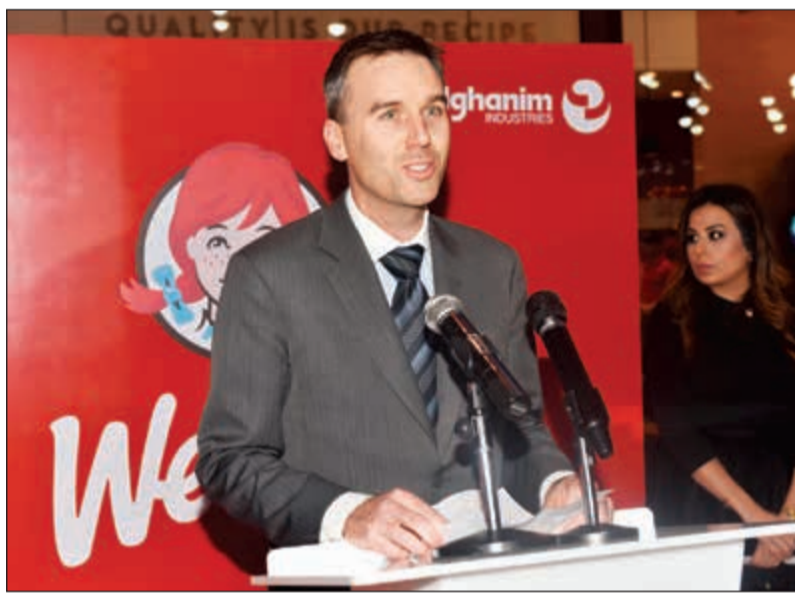
السفير الأسترالي وارين هاوك متحدثاً خلال حفل الافتتاح