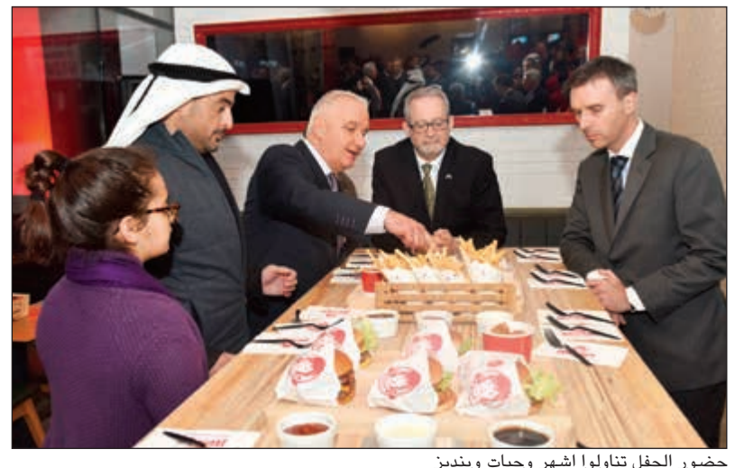
حضور الحفل تناولوا أشهر وجبات وينديز