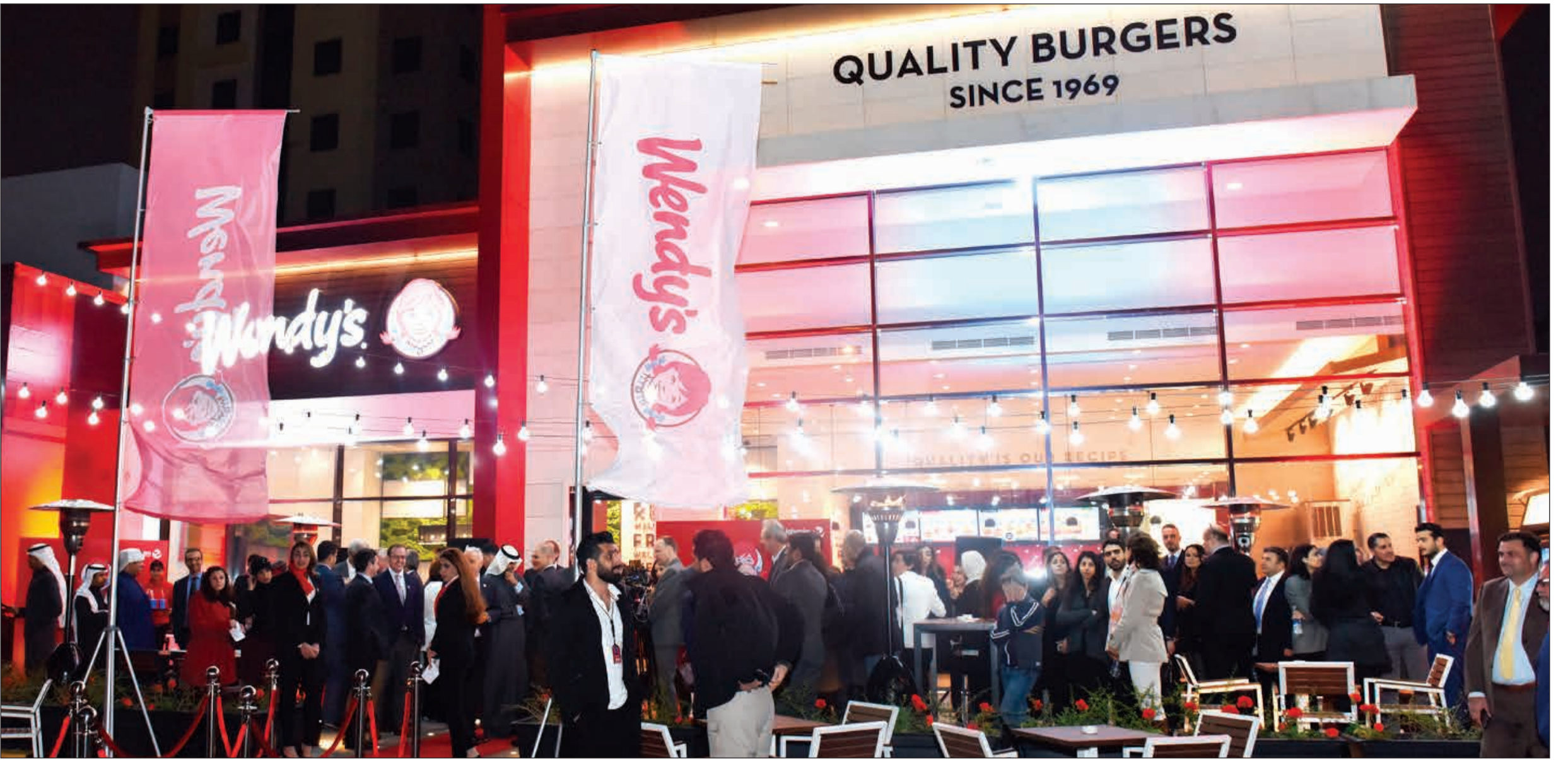
افتتاح مبهر لأول فرع لمطعم وينديز في الكويت