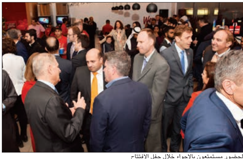
الحضور مستمتعون بالأجواء خلال حفل الافتتاح