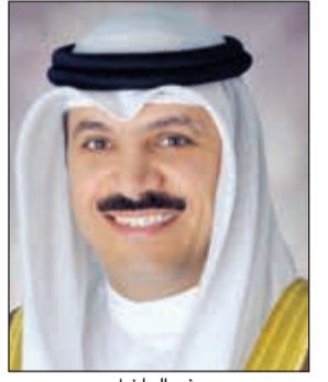
د. محمد يوسف الهاشل

صرح محافظ بنك الكويت المركزي د.محمد يوسف الهاشل بأن مجلس إدارة بنك الكويت المركزي وافق بجلسته المنعقدة بتاريخ 2017/1/31 على افتتاح