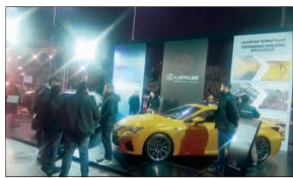
أقبال جماهيري على منصة عرض لكزس