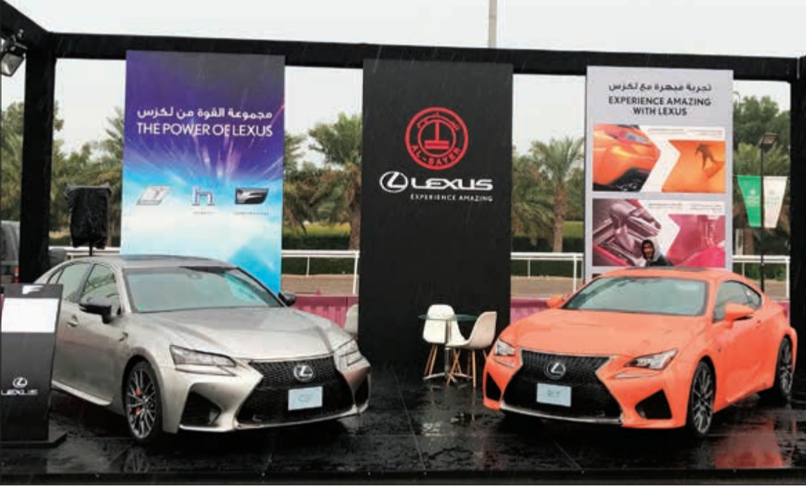
سيارات لكزس المجموعة F خلال عرضها

الهايبيرد منذ أكثر من عقد من تطوير الخبرات وإنتاج مجموعة واسعة من موديلات الهايبيرد. وخلال 10 سنوات من التكنولوجيا المبتدعة فاعليتها، قدمت لكزس هايبيرد مجموعة حلول ناجحة لعملائها اليوم، من خلال تقديم أداء لا يمكن المساومة عليه وتجربة قيادة متمعة، أعادت لكزس تعريف معالم مركبات الهايبيرد الفاخرة.