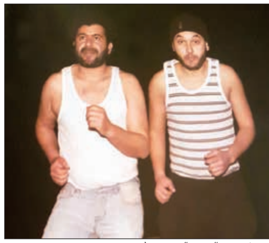
.. ومشهد من العرض التونسي «ثنين»