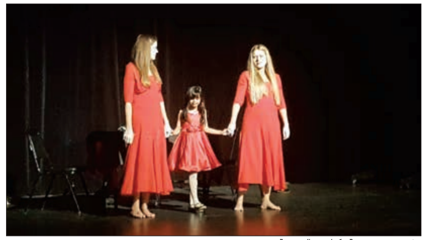
مشهد من مسرحية «كباريه» المصرية