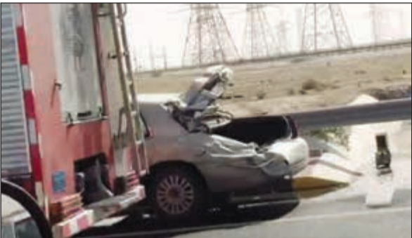
مركبات «الإطفاء» تسحب المركبتين المتصادمتين

شهد طريق الدائري السادس السريع حادث تصادم بين مركبتين تسبب في انقلاب إحدهما وأسفر عن إصابة شخصين حيث