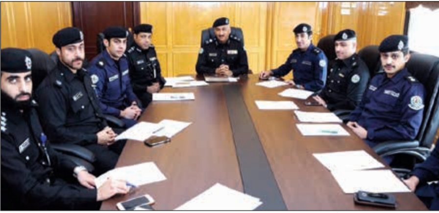
اللواء فهد الشويح متوسلاً أعضاء اللجنة المنظمة

ترأس وكيل وزارة الداخلية المساعد لشؤون المرور مدير عام الإدارة العامة للمرور اللواء فهد الشويح الاجتماع الأول لأعضاء اللجنة المنظمة لأنشطة أسبوع المرور الخليجي الموحد 33 أول اجتماعاتها أمس سيبدأ اعتباراً من 12 مارس المقبل تحت شعار «حياتك أمانة»، ورحب اللواء الشويح خلال الاجتماع بأعضاء اللجنة، متمنياً لهم التوفيق في أعمالهم، وحثهم على خلق أفكار وآراء ومقترحات جديدة للخروج