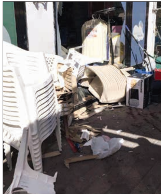
فرع لوازم العائلة وقد لحقت به اضرار مادية