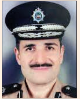
اللواء طلال معرفي