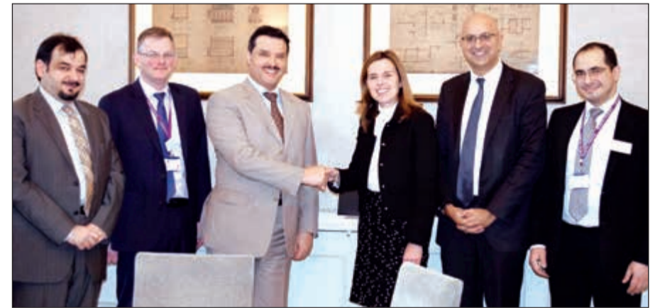
د. جمال الحربي خلال لقائه مع مديرة مستشفى «رويال مارسدن» لعلاج أمراض السرطان

للمستوى العالي والرعاية المتميزة التي يقدمها المستشفى للمرضى الكويتيين والذي يعد احد اكبر المراكز المتخصصة في علاج امراض السرطان بالعالم. وفي السياق، عقد الوزير الحربي في وقت لاحق أمس الثلاثاء عددا من اللقاءات مع قيادات مستشفى (كرومويل) للاطلاع على خطط علاج المرضى الكويتيين في المستشفى.