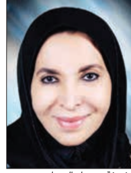
الشيخة دسعاد الصباح