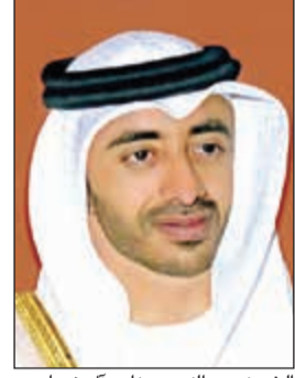
الشيخ عبدالله بن زايد آل نهيان

أشاد وزير خارجية الإمارات العربية المتحدة الشيخ عبدالله بن زايد آل نهيان بمناقب مؤسس الكويت الحديثة الشيخ مبارك الصباح (مبارك الكبير) ونجله الشيخ عبدالله المبارك الصباح رحمهما الله.